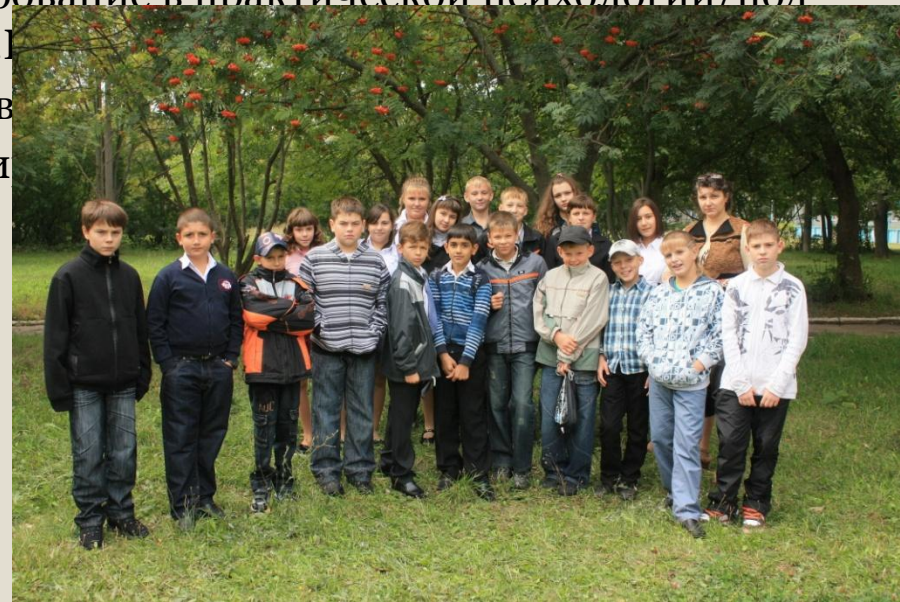
Фильм о нашем классе