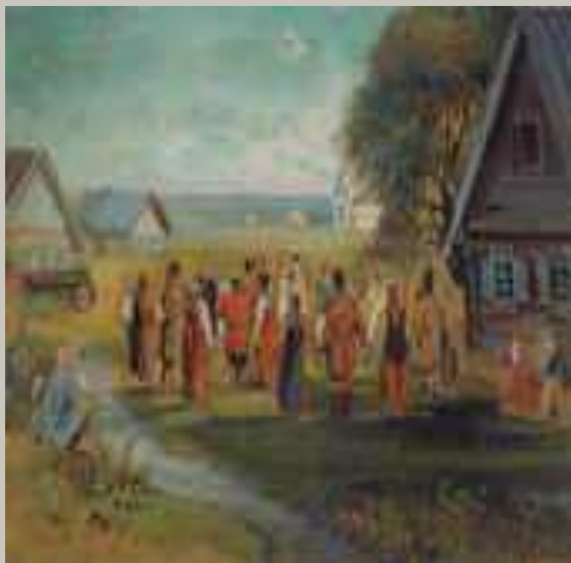
Хоровод в селе (1873-1874 гг)