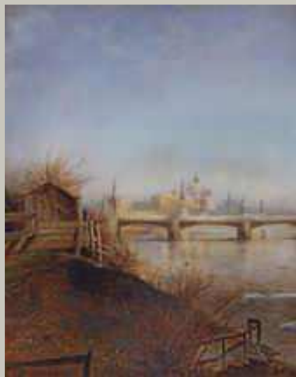
Вид на Московский Кремль (1873 г)