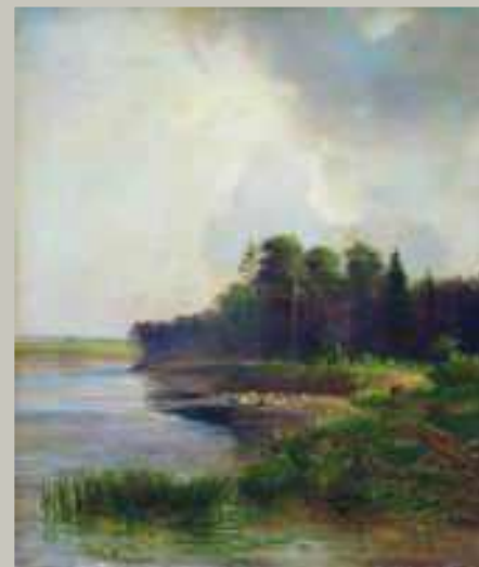
Берег реки (1879 г)