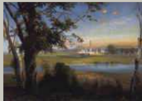
Новодевичий монастырь (1890г)