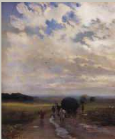
После дождя (1880-е г)