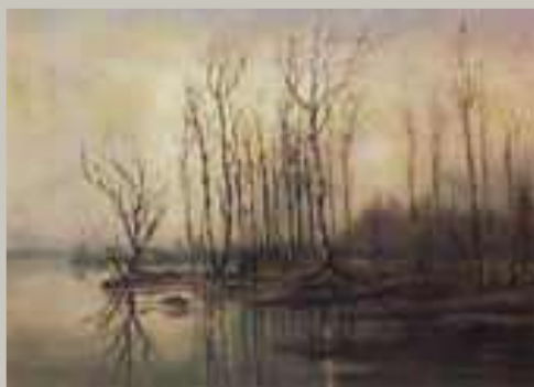
Ранняя весна. Половодье. (1868 г)