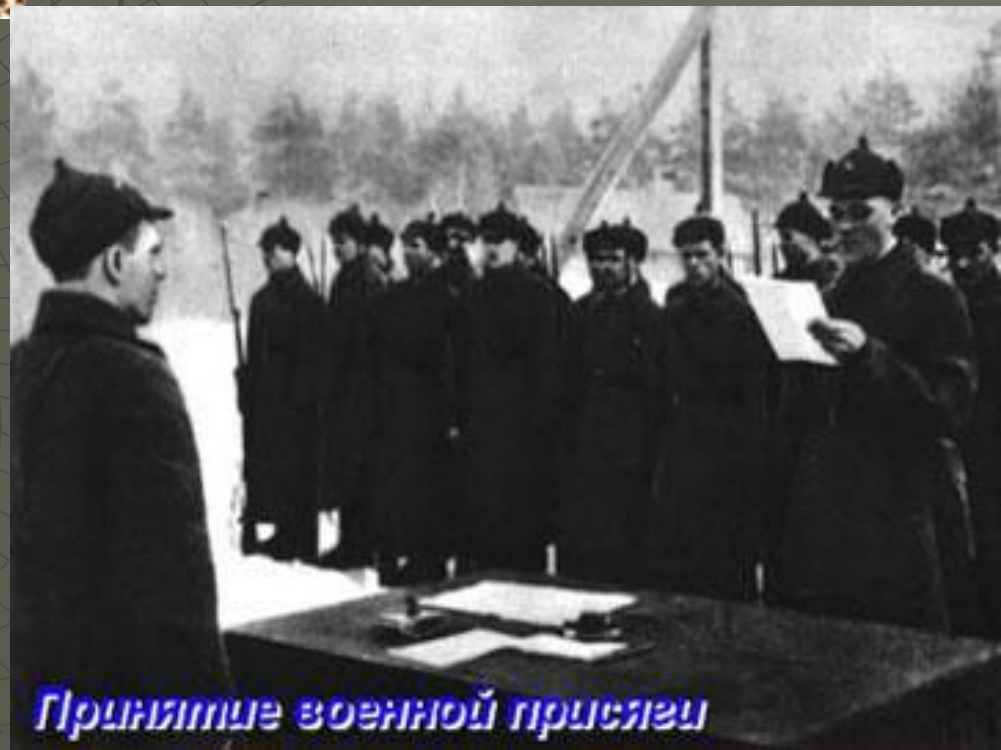
Принятие военной присяги

постановлением ВЦИК установлен единый для всей армии и флота день и порядок принятия присяги