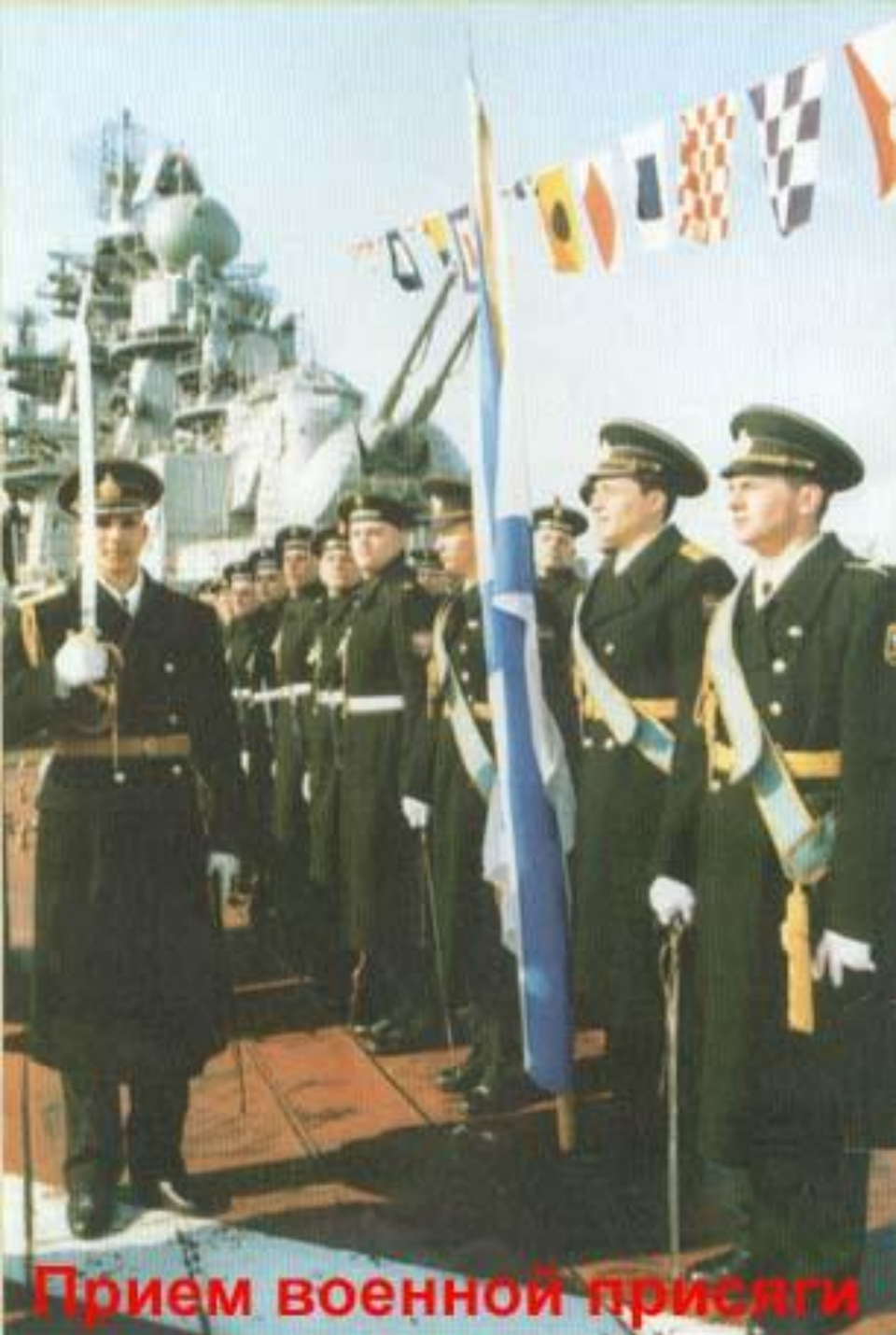
Прием военной присяги