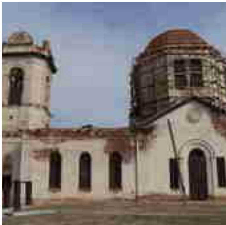
Храм Успения Пресвятой богородицы С. Копановка