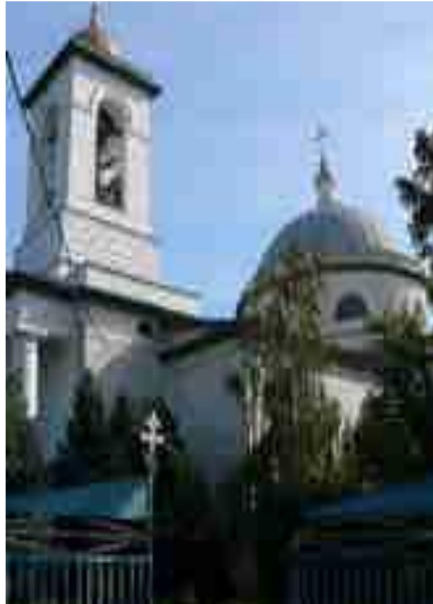
Свято-Троицкий собор С.Енотаевка