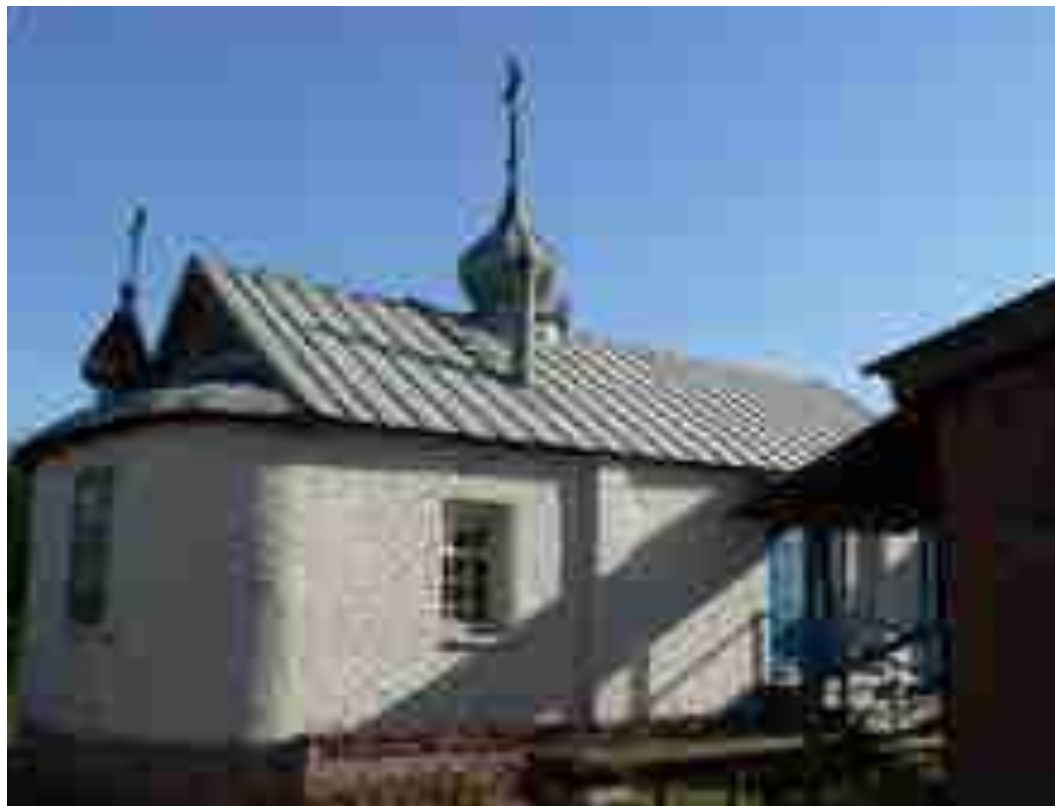
Петрово- Павловский храм С.Сероглазовка