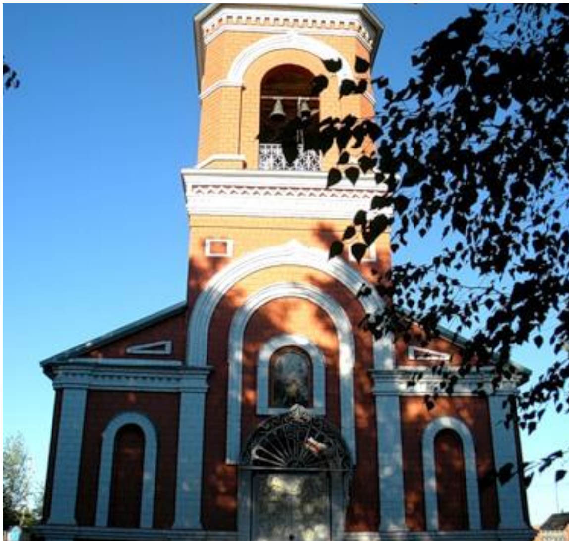
Преображенский храм С.Замьяны