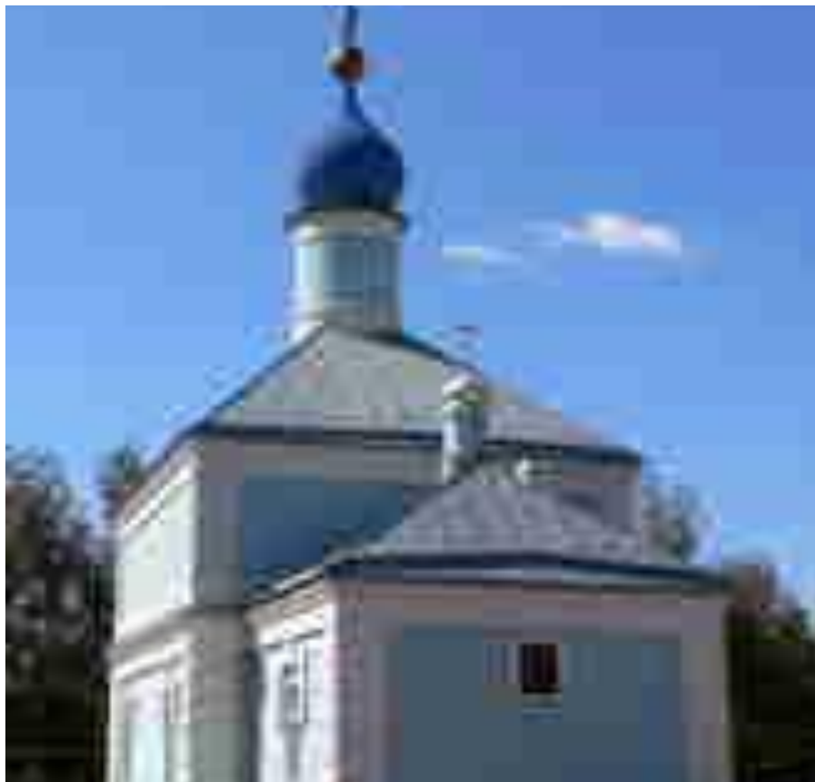
Храм Донской иконы Божией Матери с.Грачи