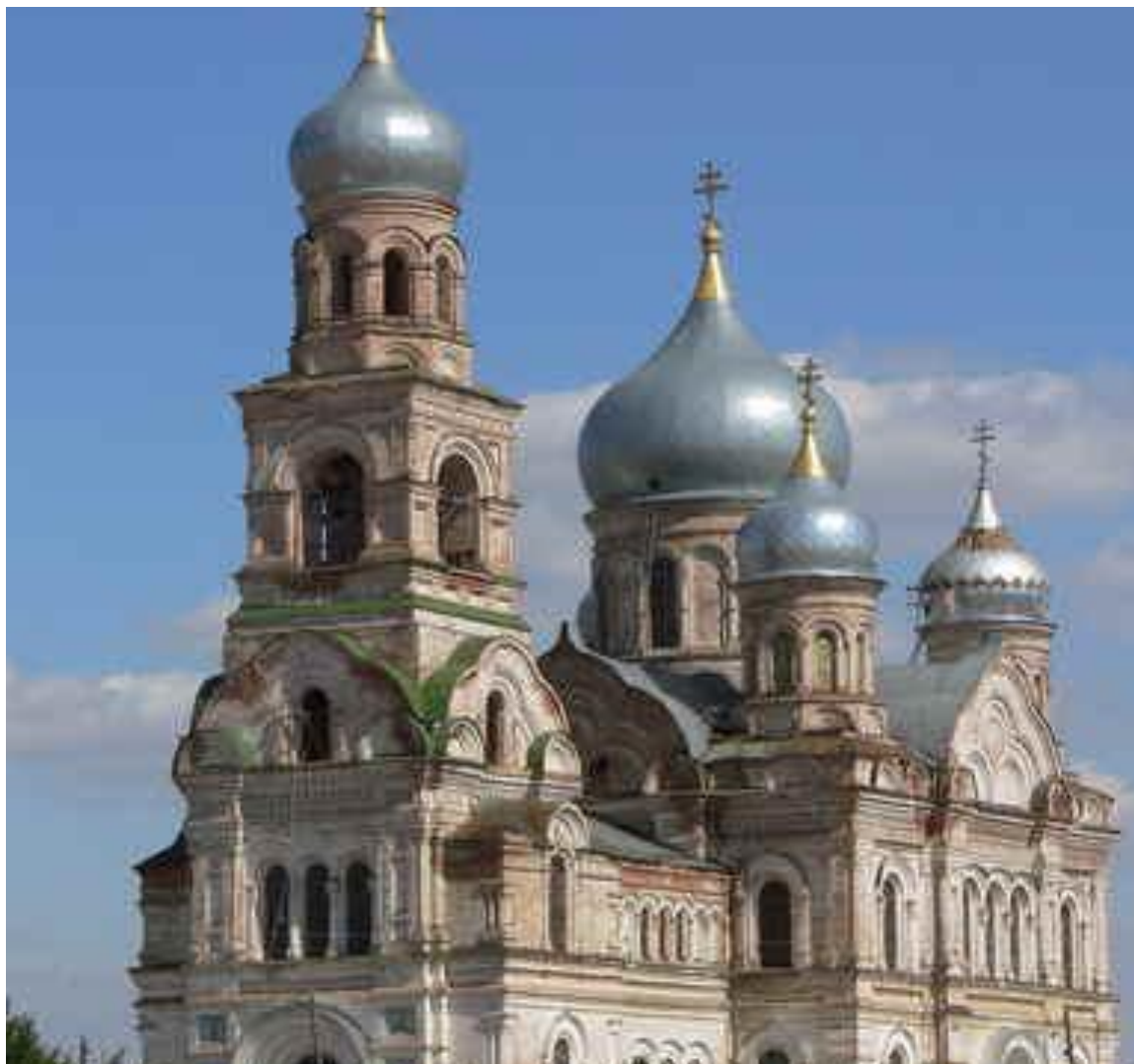
Храм Рождества Пресвятой богородицы с.Никольское