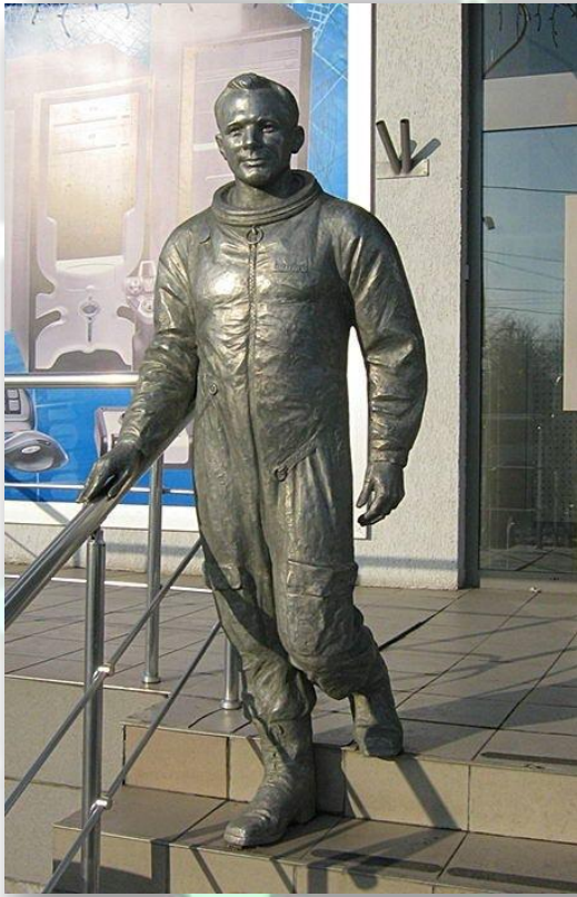
Памятник Ю. Гагарину в Харькове