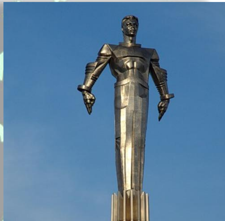
Памятник Ю. Гагарину в Москве

Во многих городах России и других стран существуют улицы, проспекты, площади, бульвары, парки, клубы и школы имени Гагарина.