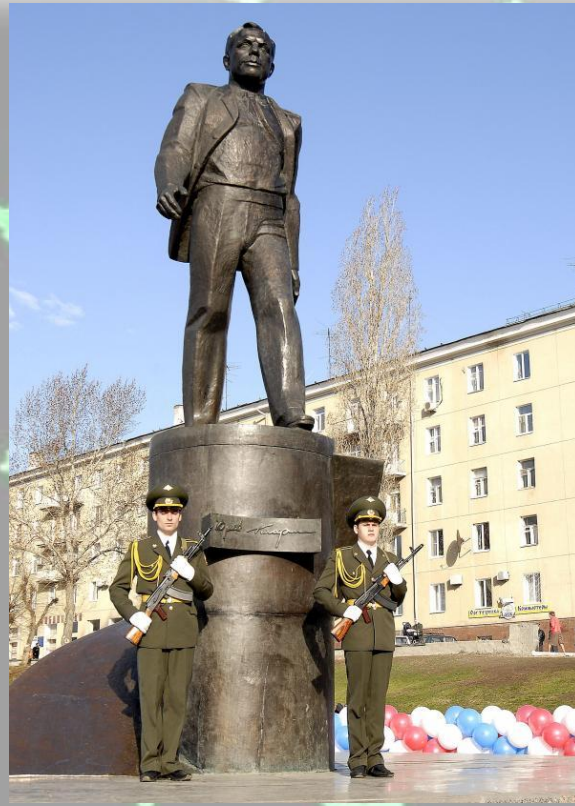
Памятник , Гагарину в Саратове на Набережной Космонавтов