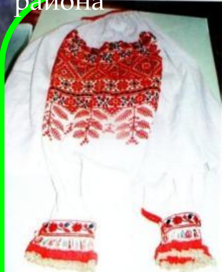
Кашуля изготовлена А. М. Евтиховой, Орменка