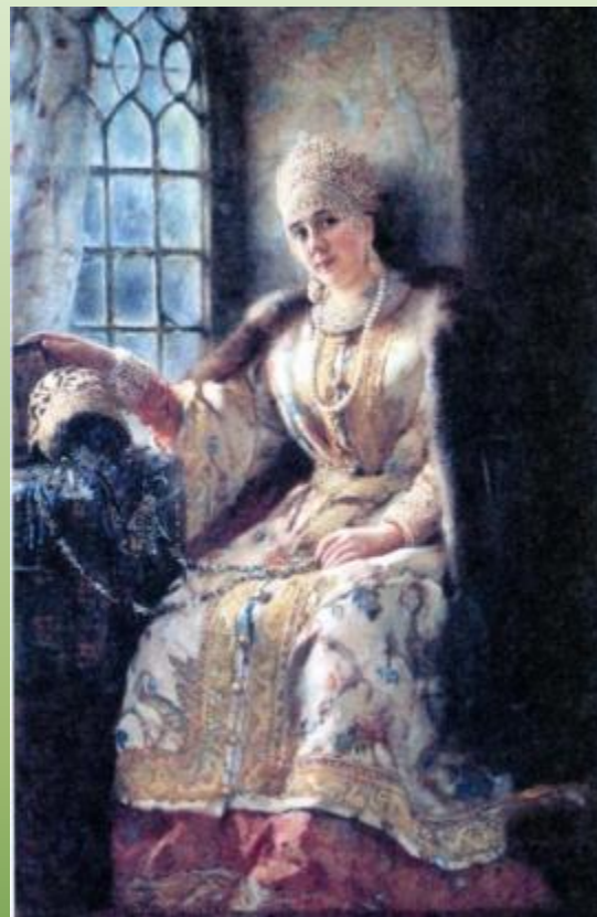
Боярыня у окна