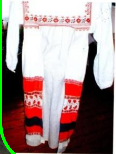
Элементы одежды: фартук, рубала