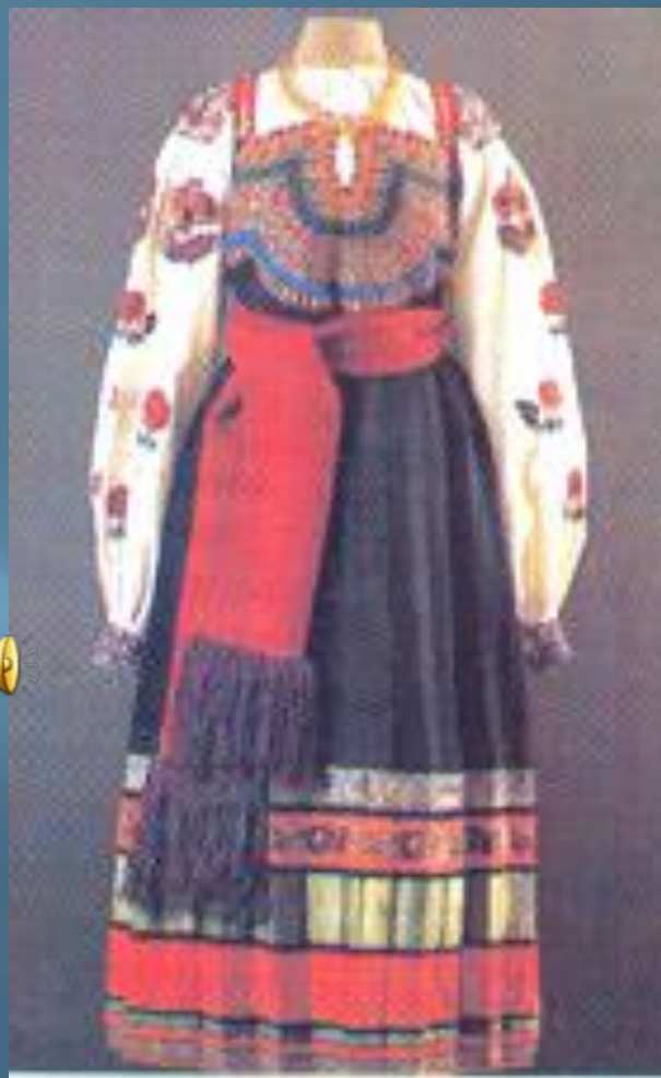
Народный костюм 19 века