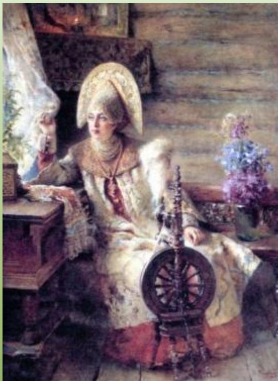
К. Маковский Боярыня у окна (с прялкой)