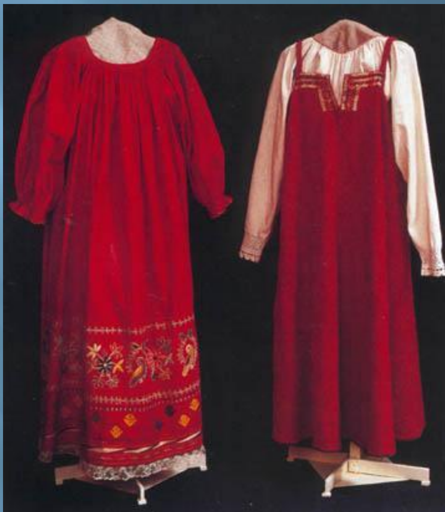
Народный костюм 19 века