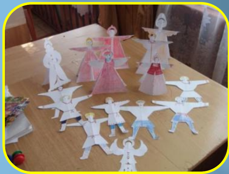
Работы детей. Тема: «Русский костюм» (Конструирование из