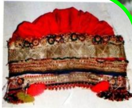
Головной убор жителей д. Скрабино