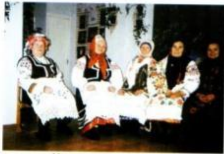
Мастерицы Хмелево в народных костюмах