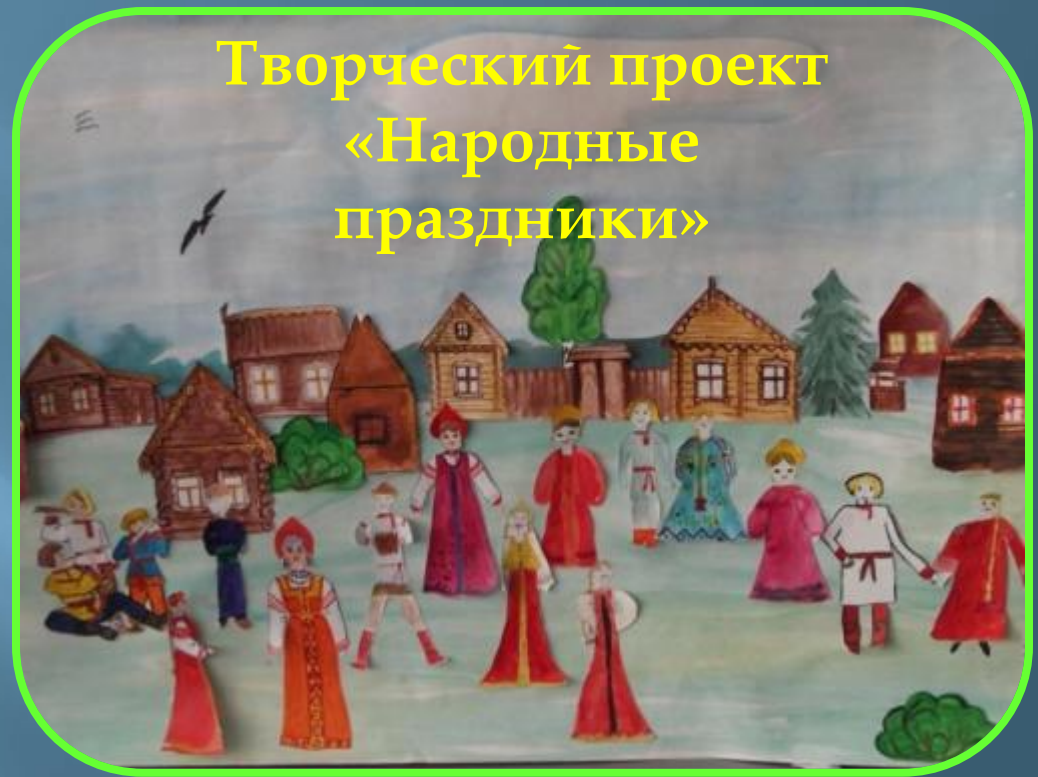
Творческий проект «Народные праздники»