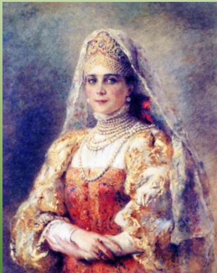
Портрет княгини Юсуповой в русском костюме