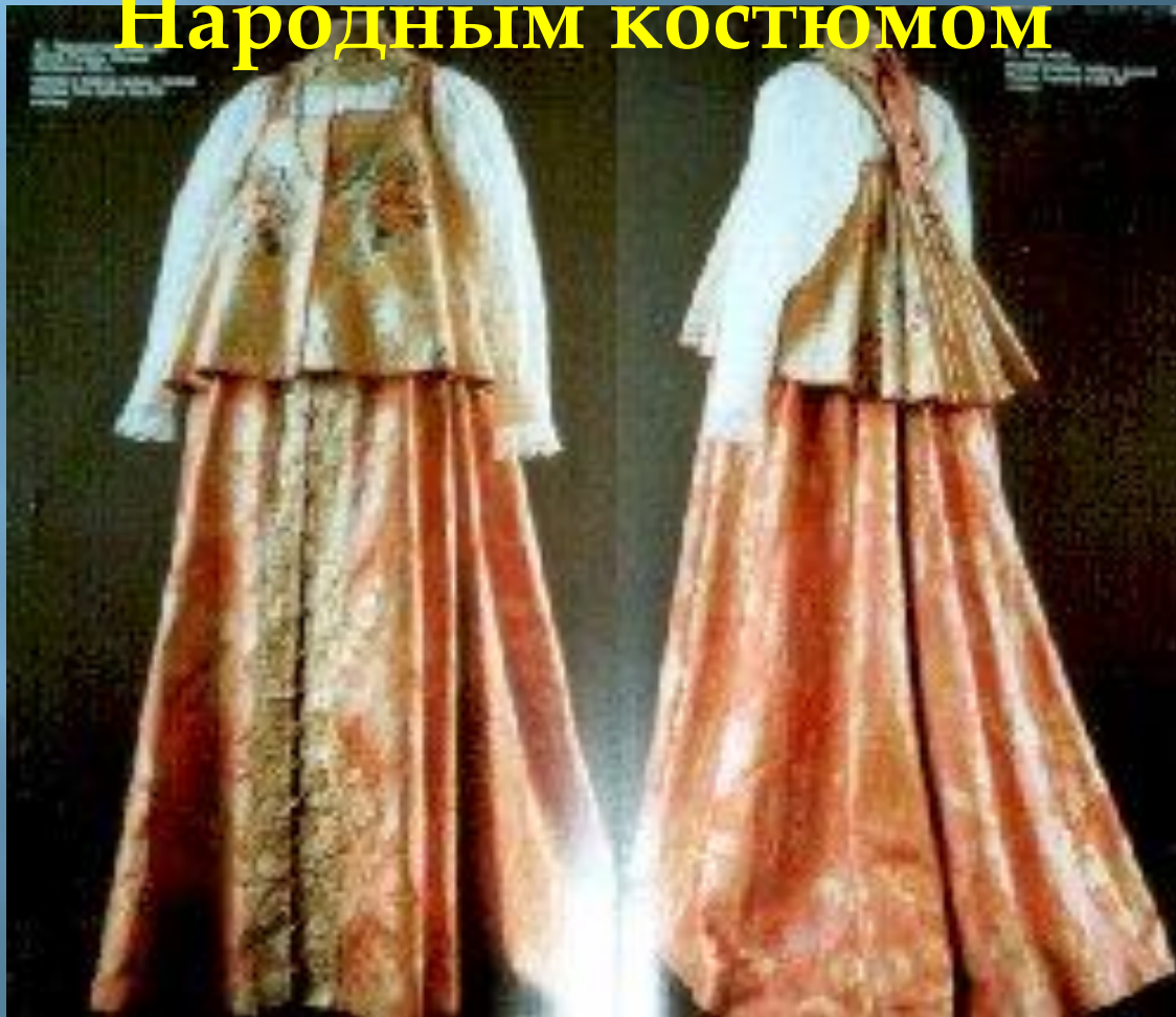
Костюм Московской Руси 15 – 17 века