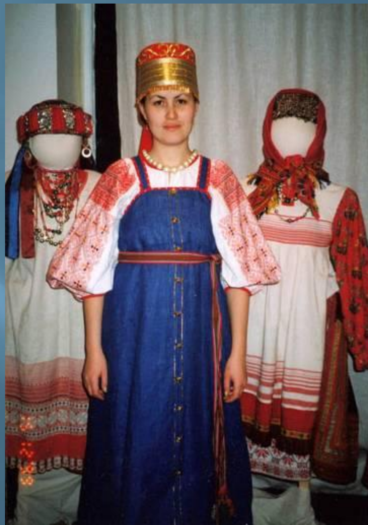
Народный костюм 19 века