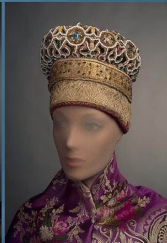
Костюм Московской Руси 15 – 17 века