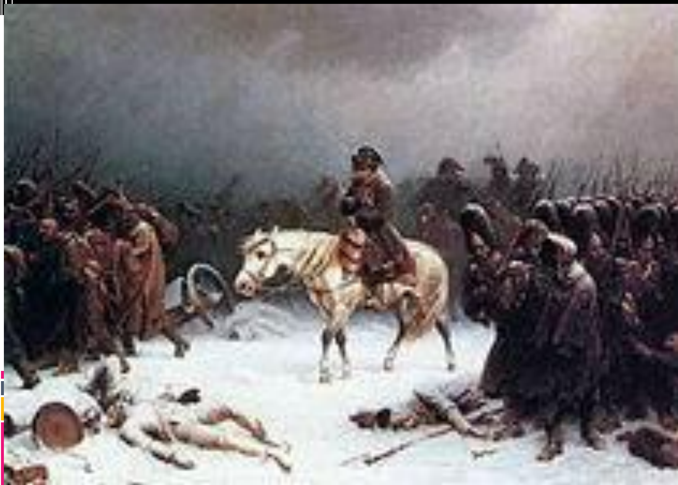
Отступление французской армии