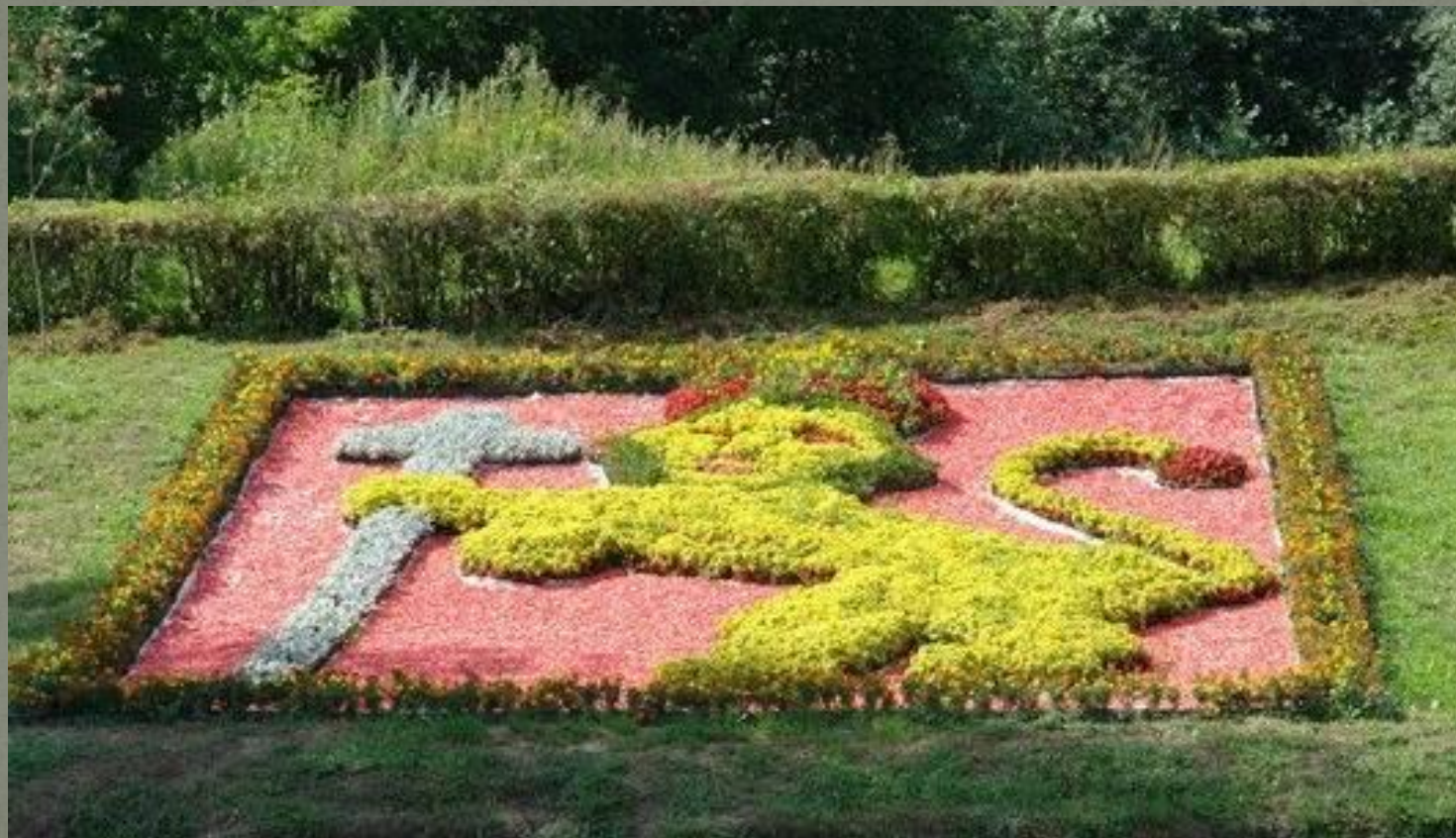
Герб нашего города – Золотой Лев

Владимир- очень чистый и красивый город.