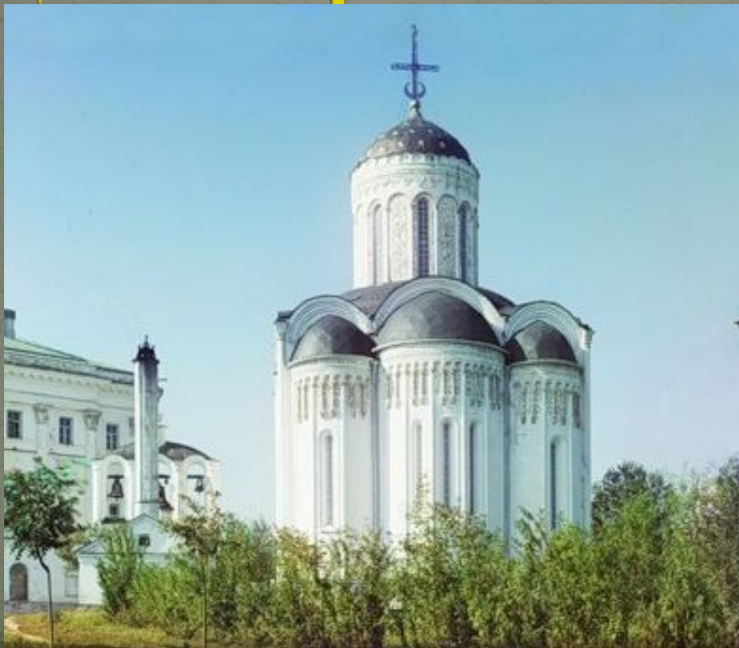
Дмитриевский Собор. Фото 1912г.