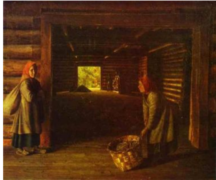
Художник Григорий Васильевич Сорока

Это было связано не с новыми формами труда, а с освоением новых земель, которые Россия завоевала в Северном Причерноморье