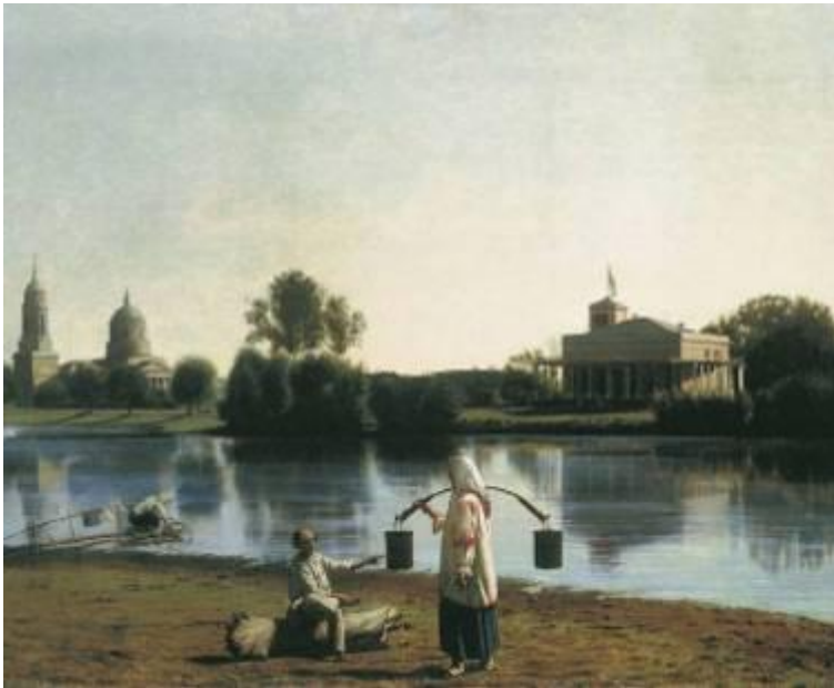
Художник Григорий Васильевич Сорока

Сельское хозяйство в 60—90-х годах развивалось довольно успешно.