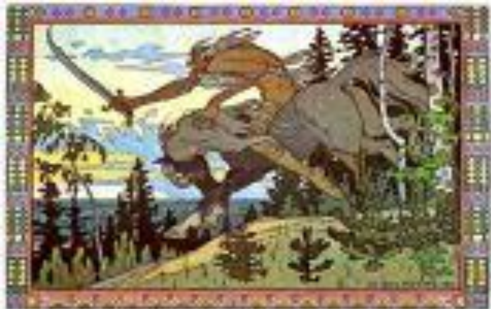
Кащей Бессмертный. К сказке Марья Моревна