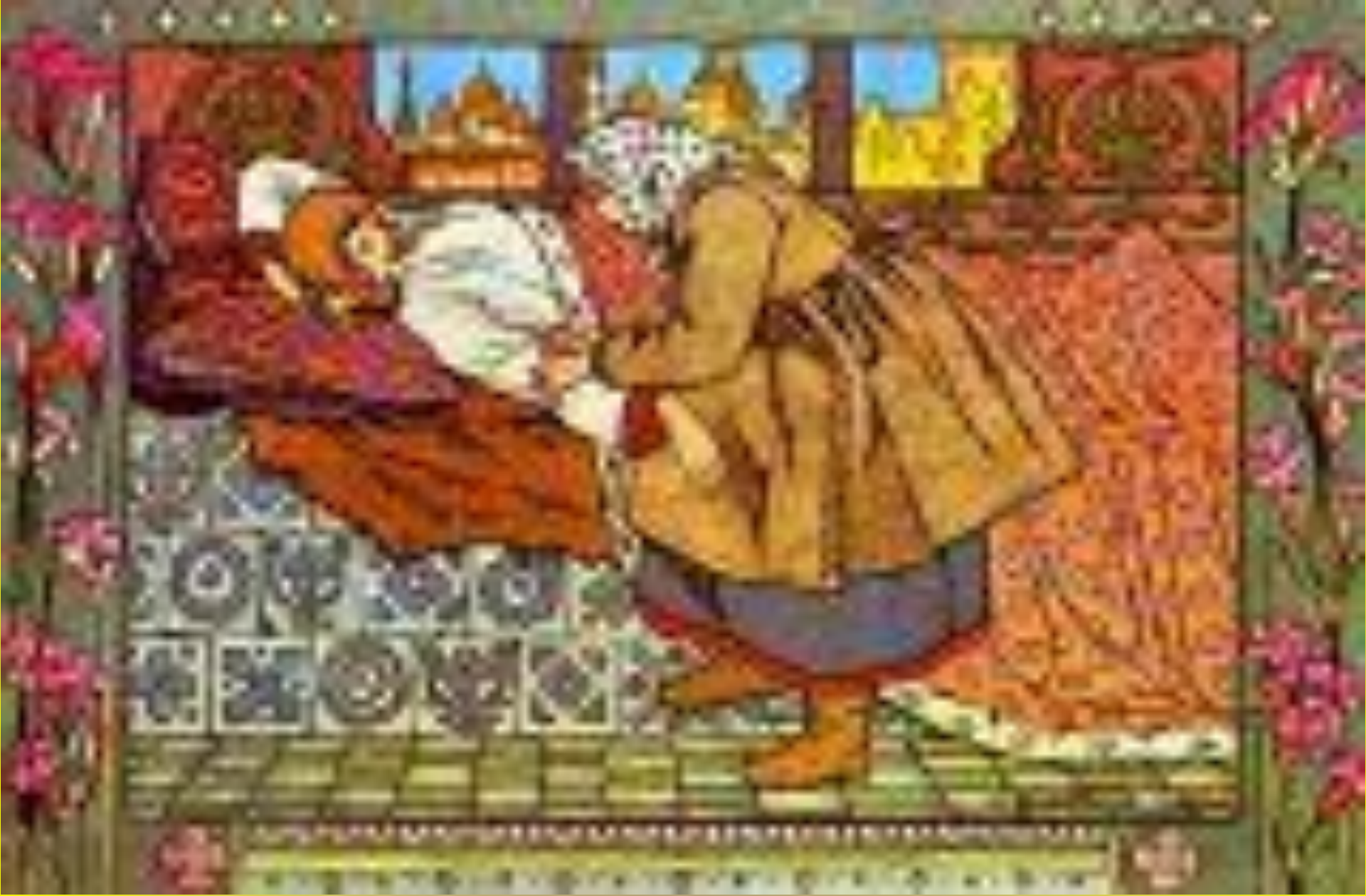
Иллюстрация к сказке Перышко Финиста Ясного Сокола