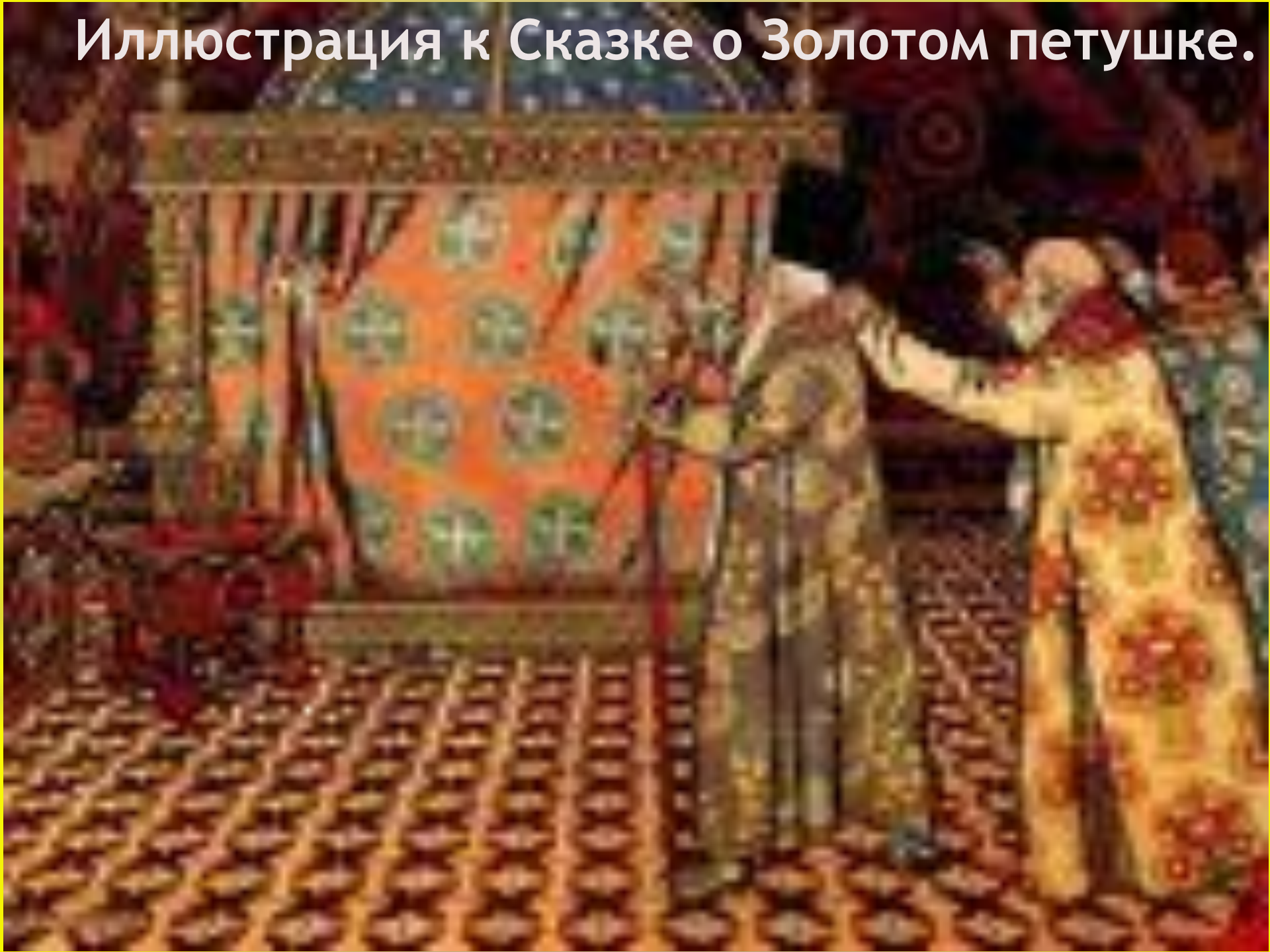
Иллюстрация к Сказке о Золотом петушке.