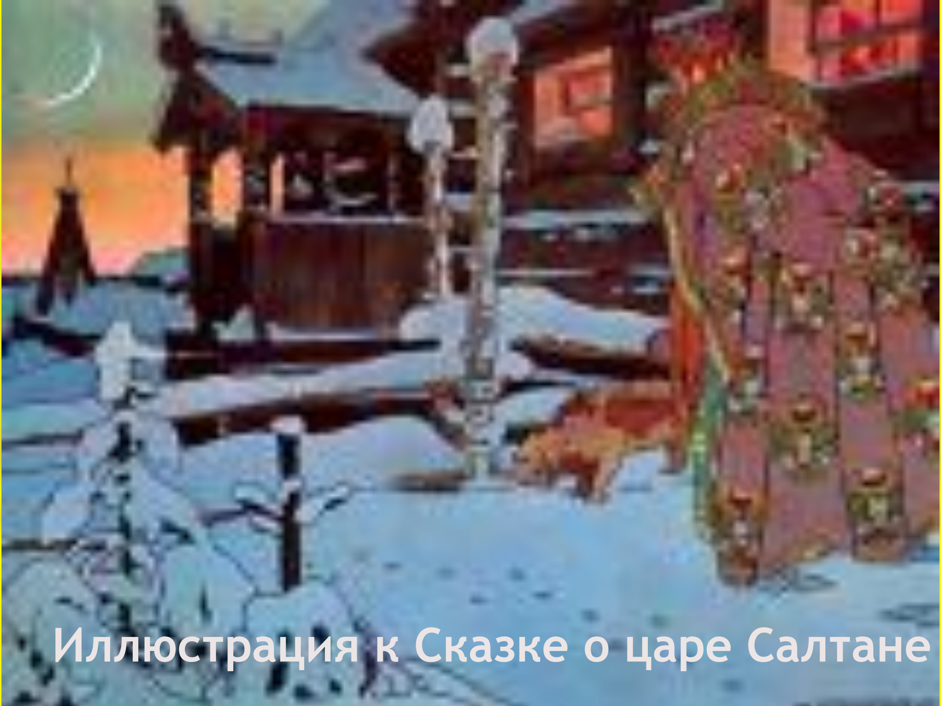
Иллюстрация к Сказке о царе Салтане