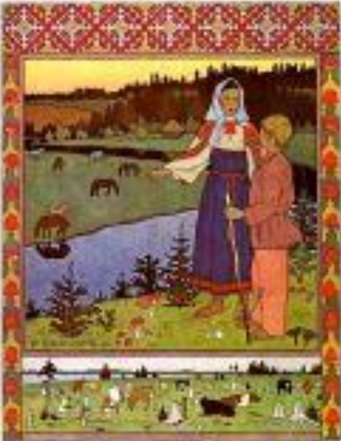
Иллюстрация к сказке Сестрица Аленушка и братец Иванушка.