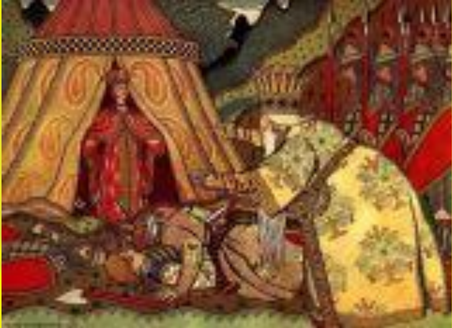
Иллюстрация к Сказке о Золотом петушке.