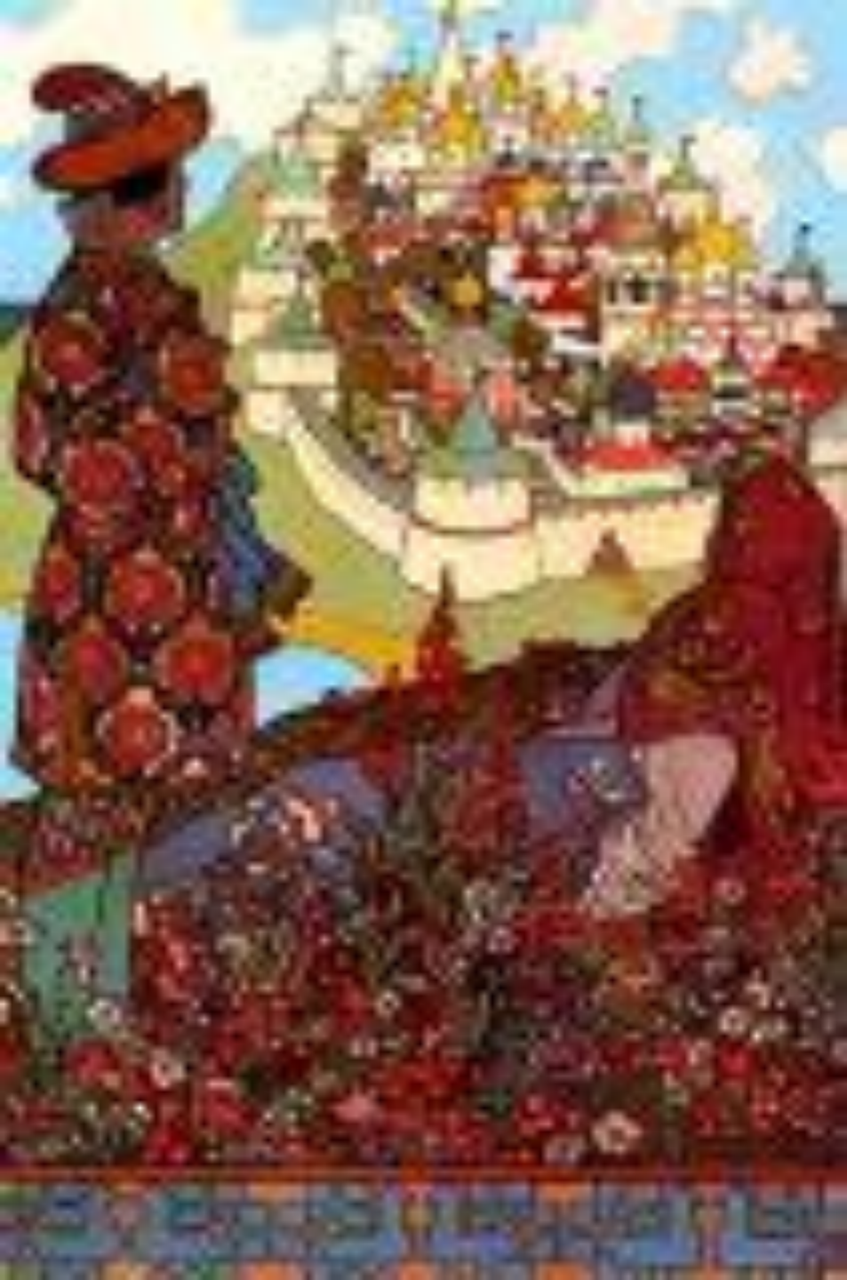
Иллюстрация к Сказке о царе Салтане.