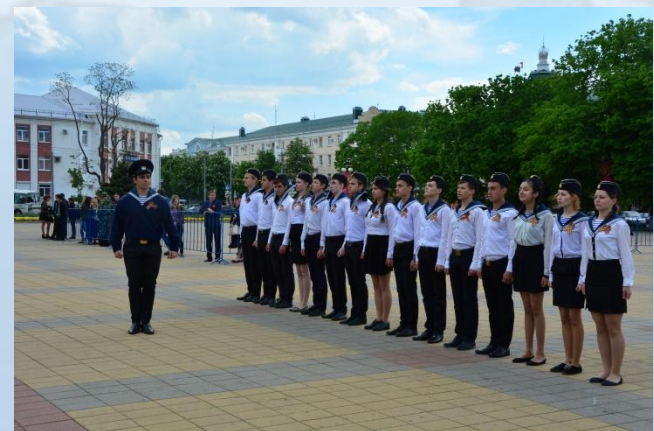
МБОУ "Лицей №35" ДОО "Глобус"