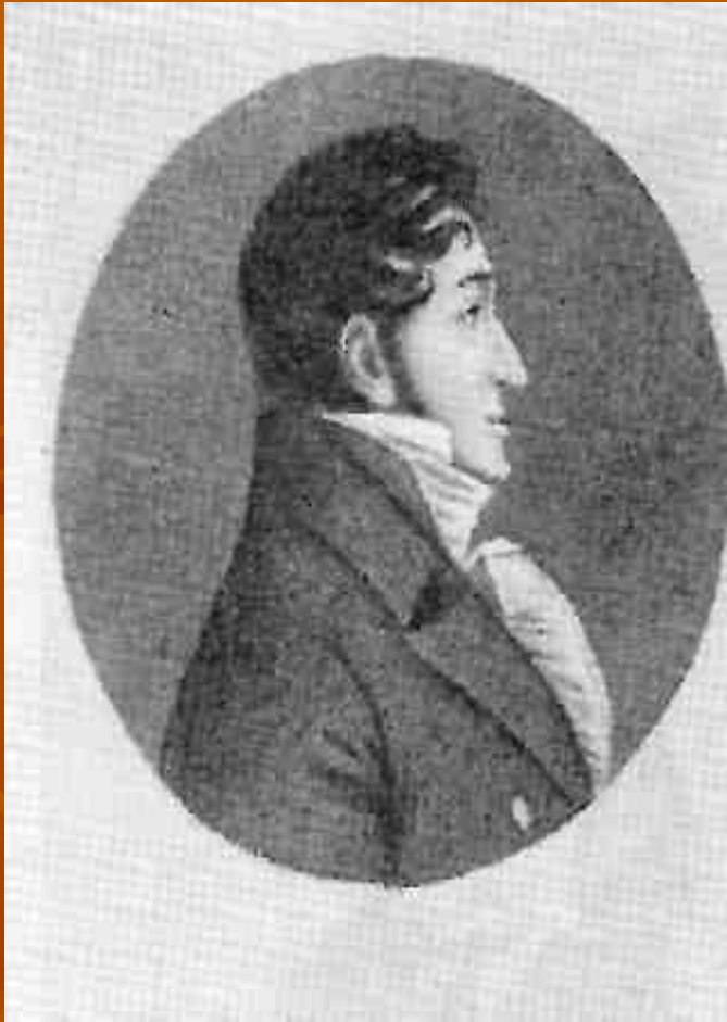
Василий Львович Пушкин (дядя поэта)

подражателем Дмитриева Родился в Москве. 18-летним юношей блистал в московских салонах; служил в Измайловском полку, поручиком вышел в отставку и поселился в Москве. 1803—1804 гг. Пушкин провёл за границей, главным образом в Париже. Он принадлежал к школе «классиков» и не сочувствовал романтическому направлению. В своей поэме «Капитан Храбров» Василий Пушкин осмеивал представителей романтизма. Сам он был приверженцем «лёгкой поэзии» и подражателем Дмитриева; писал «песни», послания, эпиграммы и т. п., подражал Горацию Родился в Москве. 18-летним юношей блистал в московских салонах; служил в Измайловском полку, поручиком вышел в отставку и поселился в Москве. 1803—1804 гг. Пушкин провёл за границей, главным образом в Париже. Он принадлежал к школе «классиков» и не сочувствовал романтическому направлению. В своей поэме «Капитан Храбров» Василий Пушкин осмеивал