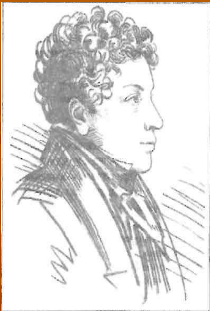
Лев Сергеевич Пушкин (1805-1852) брат поэта

Младший брат А. С. Пушкина, воспитанник Благородного пансиона при Царскосельском лицее (1814-1817) и Благородного пансиона при Главном педагогическом институте (1817 -1821; курса не кончил). В ноябре 1824 Л. С. Пушкин поступил в Департамент иностранных вероисповеданий, через два года вышел в отставку и определился юнкером в Нижегородский драгунский полк. Общение Пушкина с братом продолжалось всю жизнь поэта. Со Львом Сергеевичем Пушкиным связаны стихотворения "Брат милый, отроком расстался ты со мной" (1823), "Послание к Л. Пушкину" (1824) и упоминания в других произведениях. Сохранились 40 писем Пушкина к брату и 4 письма последнего к поэту.