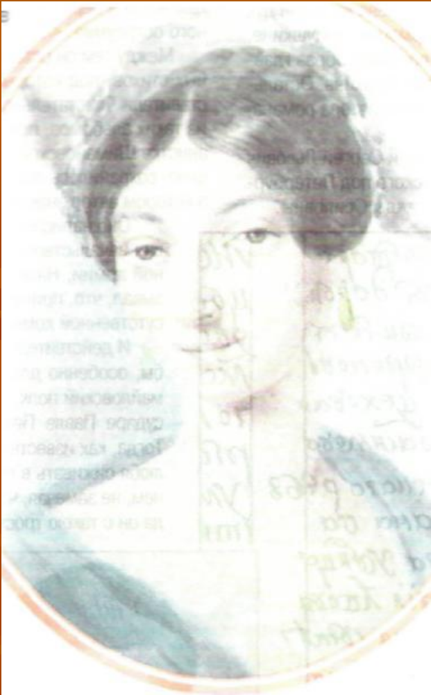
Ольга Сергеевна Павлищева (1797-1868) (сестра поэта)