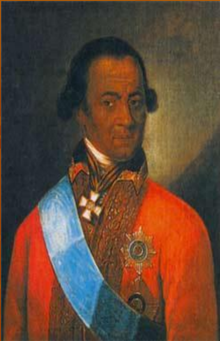
Абрам Петрович Ганнибал (прадед поэта)

Биография прадеда А.С.Пушкина, писанная на немецком, свидетельствует, что отец Ибрагима, абиссинский князь, "горделиво возводил свое происхождение по прямой линии к роду знаменитого Ганнибала, грозы Рима". Однако документально эта версия не подтверждается.