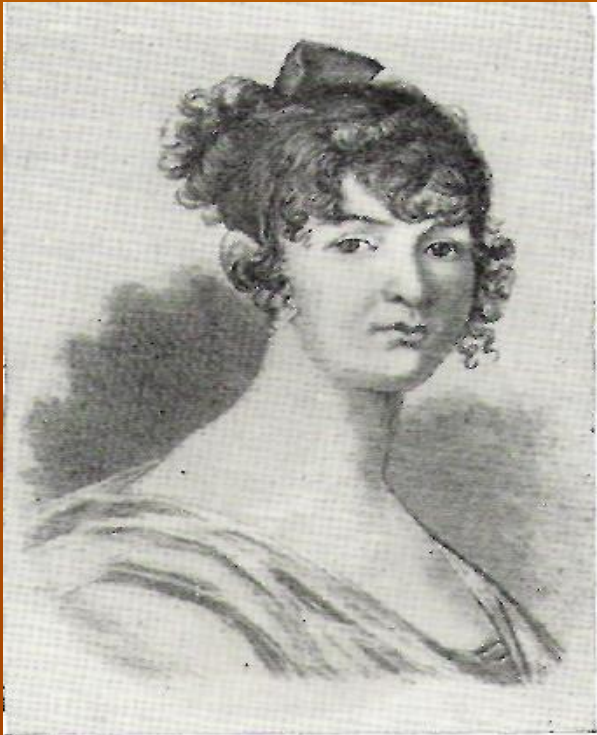
Н. О. Пушкина, мать поэта. С миниатюры Ксавье де Местра.