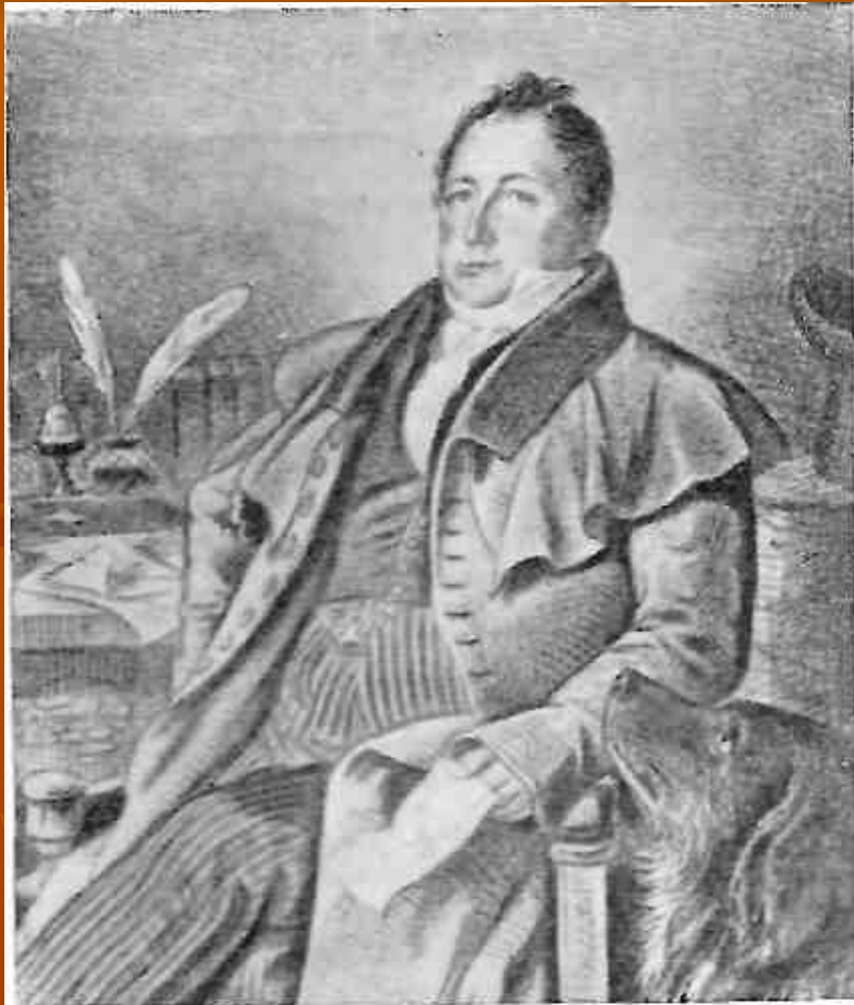
Сергей Львович (1771 -1848 ) (отец поэта)

Сергей Львович, происходил из помещичьей, когда-то богатой семьи. От имений предков (в Нижегородской губернии) до него дошло немного; но и дошедшее он проматывал, совершенно не интересуясь хозяйственными делами; служил он в Московском комиссариате, но службой не был озабочен. Среди его знакомых было много писателей, а брат его Василий Львович приобрел известность как поэт. В доме Пушкина интересовались литературой, а сам Сергей Львович был поклонником французских классиков и сам пописывал французские и русские стихи, которые, впрочем, были известны только знакомым и родственникам.