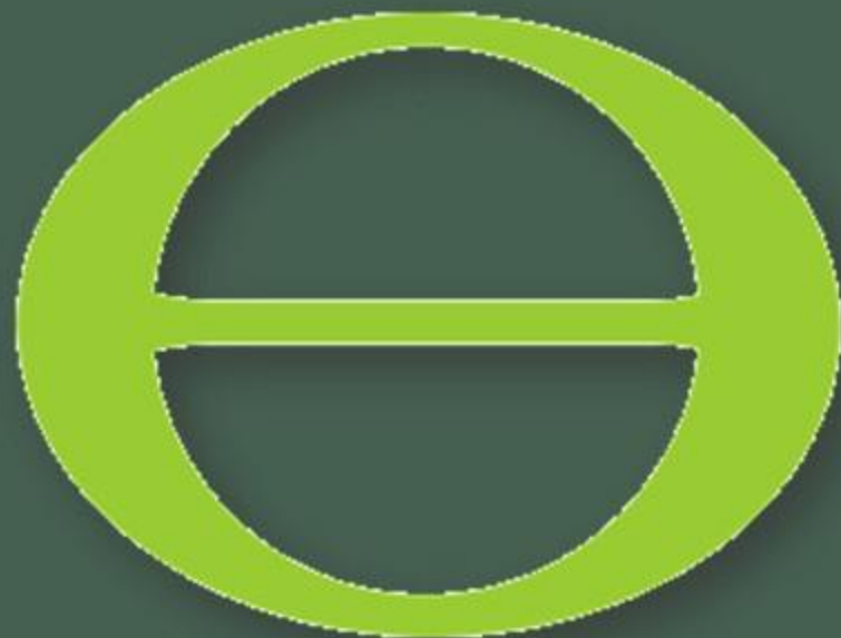
Символ дня Земли – зелёная греческая буква Θ (Тета) на белом фоне