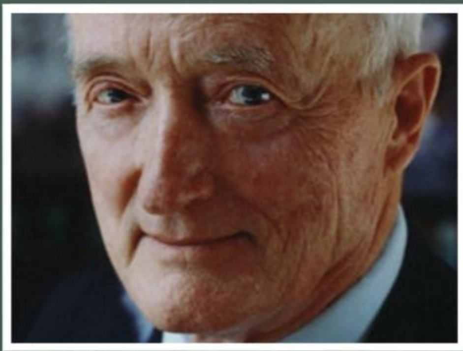
Джон Макконелл, 1915 – 2012 гг. Соединенные Штаты Америки