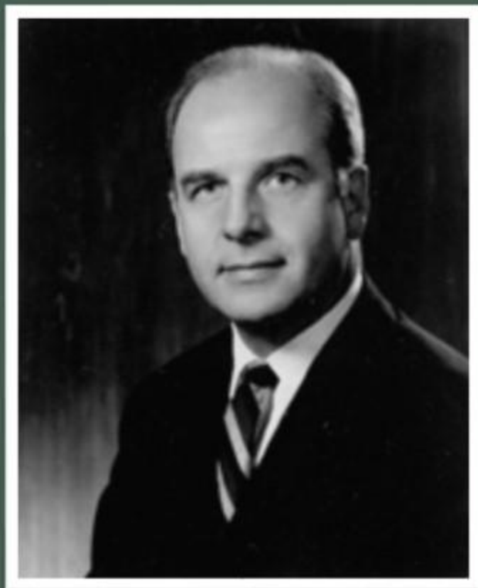
Гейлорд Нельсон, 1916 – 2005 гг. Соединенные Штаты Америки