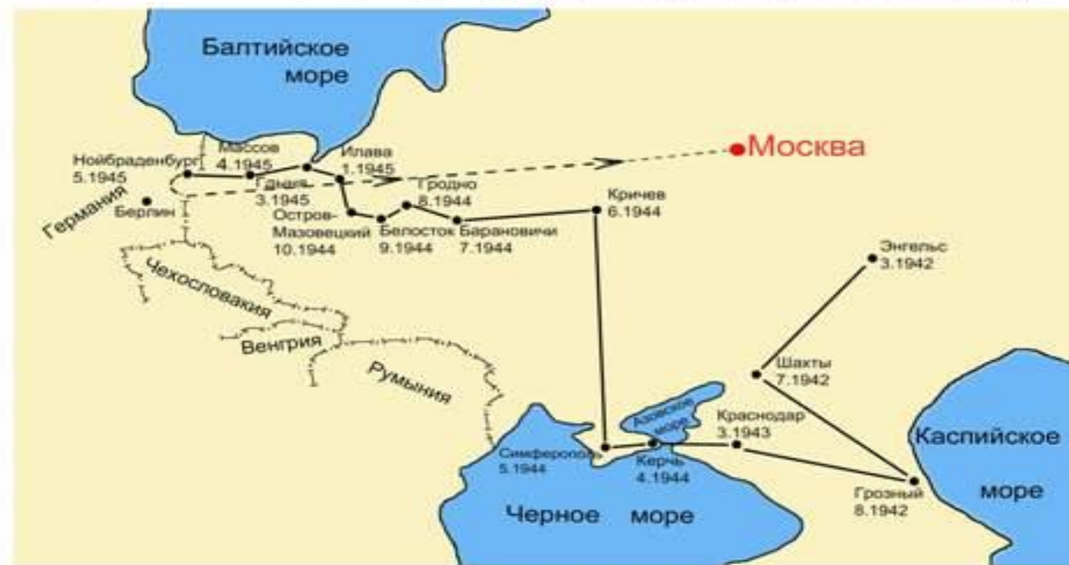
СХЕМА БОЕВОГО ПУТИ ПОЛКА