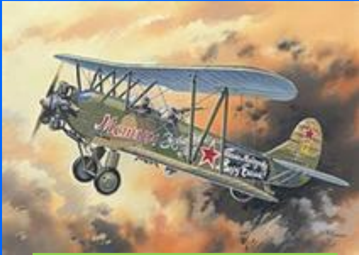
Мстим за боевых друзей