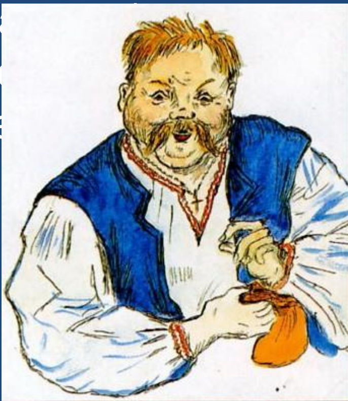
Пасечник Рудый Панько. Рис. Т.Соловей