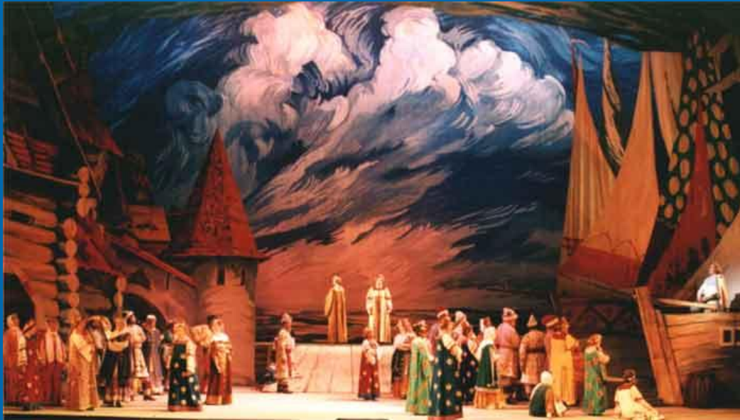
Опера "Сказка о царе Салтане"