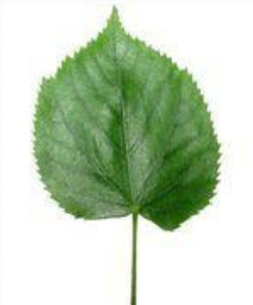
Лист липы - ... липовый лист