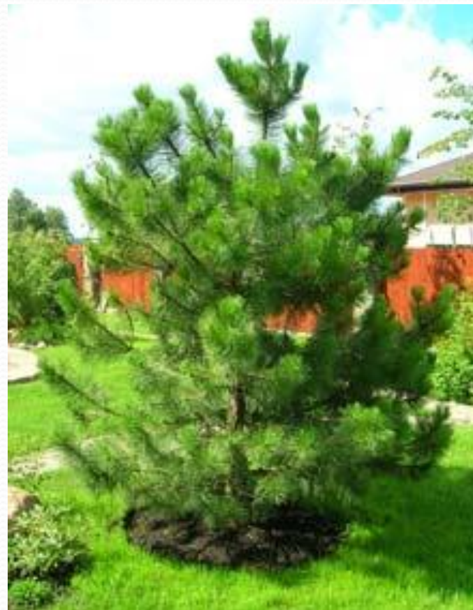
Сосна -... сосенка