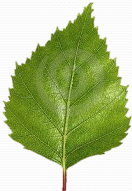
Лист берёзы-... берёзовый лист