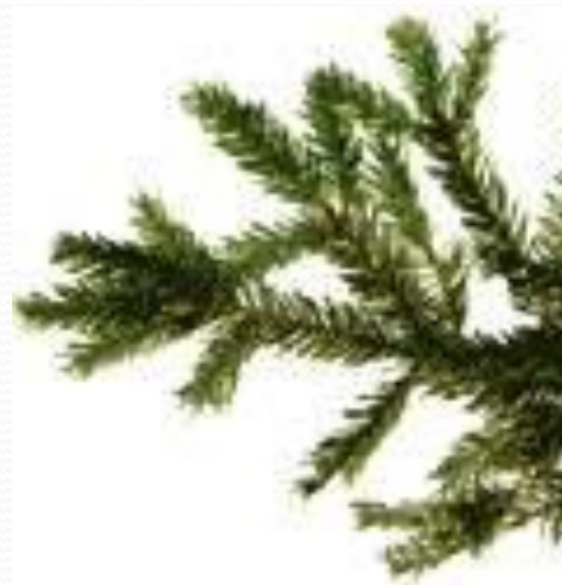
Иголки ели-... еловые иголки