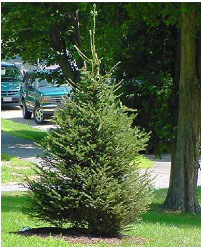
Ель -... ёлочка