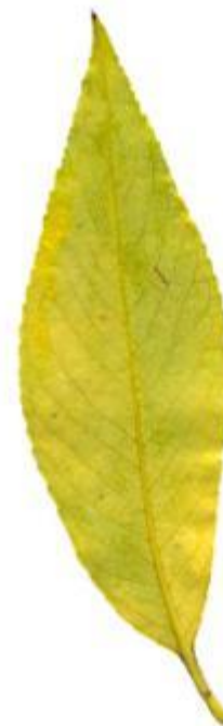
Лист ивы-... ивовый лист