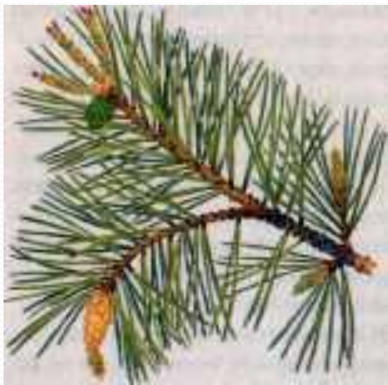
Иголки сосны-... сосновые иголки