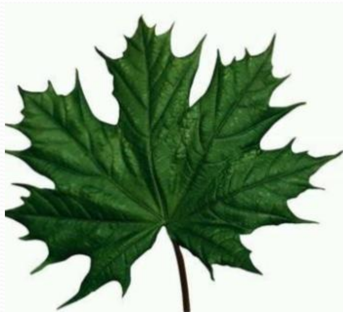
Лист клёна -... кленовый лист