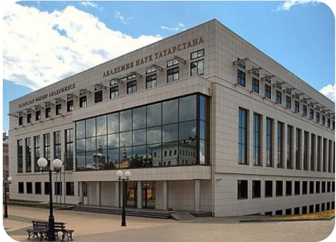
Академия наук Республики Татарстан

Сегодня Академия наук Республики Татарстан наряду с проведением фундаментальных исследований акцентирует внимание на серьезной модернизации своей структуры и деятельности. Разработана и принята Стратегия развития научной и инновационной деятельности в Республике Татарстан до 2015 года.