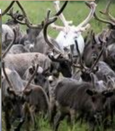
Полярная олени сова