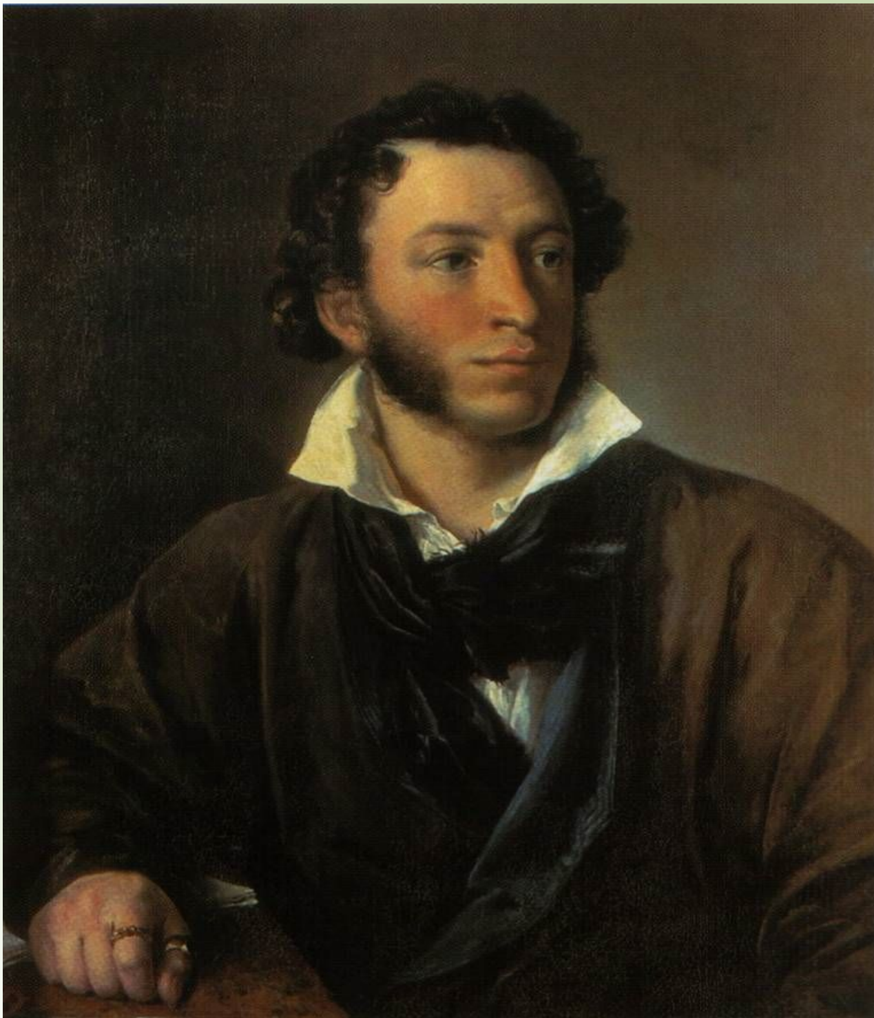
Александр Сергеевич Пушкин