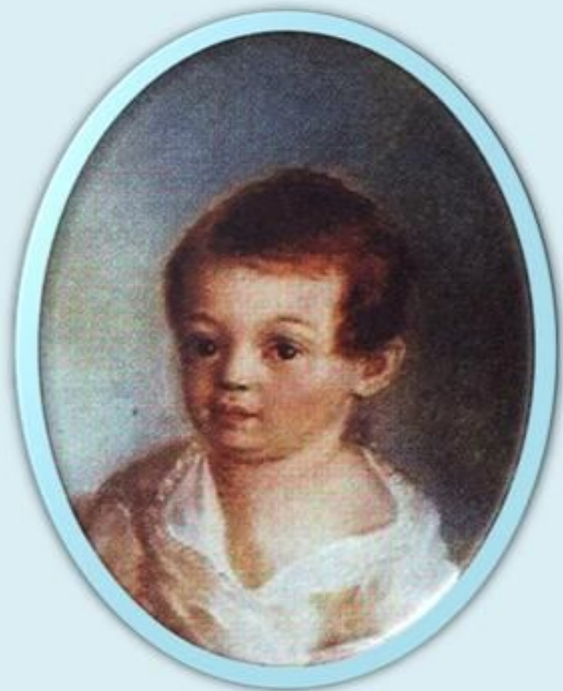
САША ПУШКИН 1802 ГОД