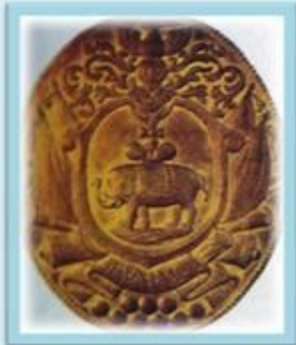
ГЕРБ РОДА ГАННИБАЛОВ

СО СТОРОНЫ ОТЦА ПУШКИН ПРИНАДЛЕЖИТ К ДРЕВНЕМУ ДВОРЯНСКОМУ РОДУ, УПОМИНАЕМОМУ В ЛЕТОПИСЯХ СО ВРЕМЁН ИВАНА ГРОЗНОГО. МАТЬ ПУШКИНА БЫЛА ВНУЧКОЙ ИБРАГИМА ГАННИБАЛА, «АРАПА ПЕТРА ВЕЛИКОГО».