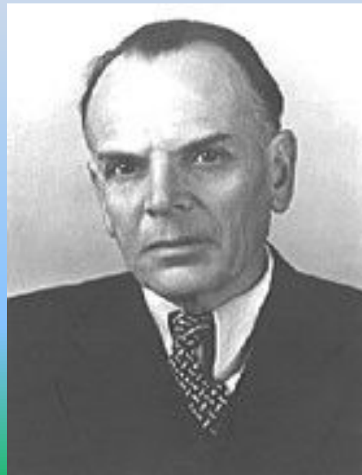
Константина Георгиевича Паустовского (1892-1968)

«Неужели мы должны любить свою землю за то, что она богата, что она дает обильные урожаи и природные ее силы можно использовать для нашего благосостояния! Не только за это мы любим родные места. Мы любим их еще за то, что даже небогатые, они для нас прекрасны».