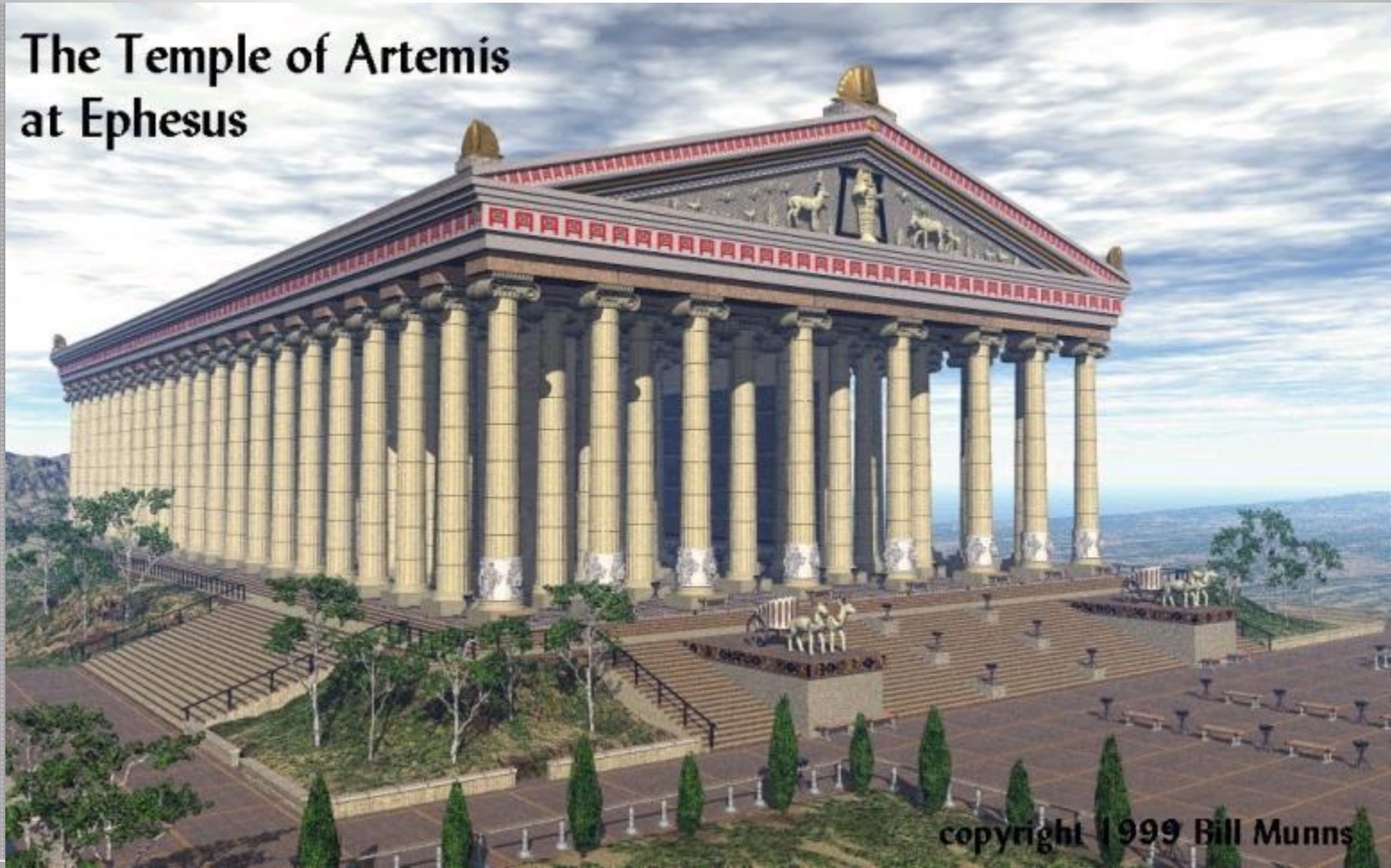
The Temple of Artemis at Ephesus