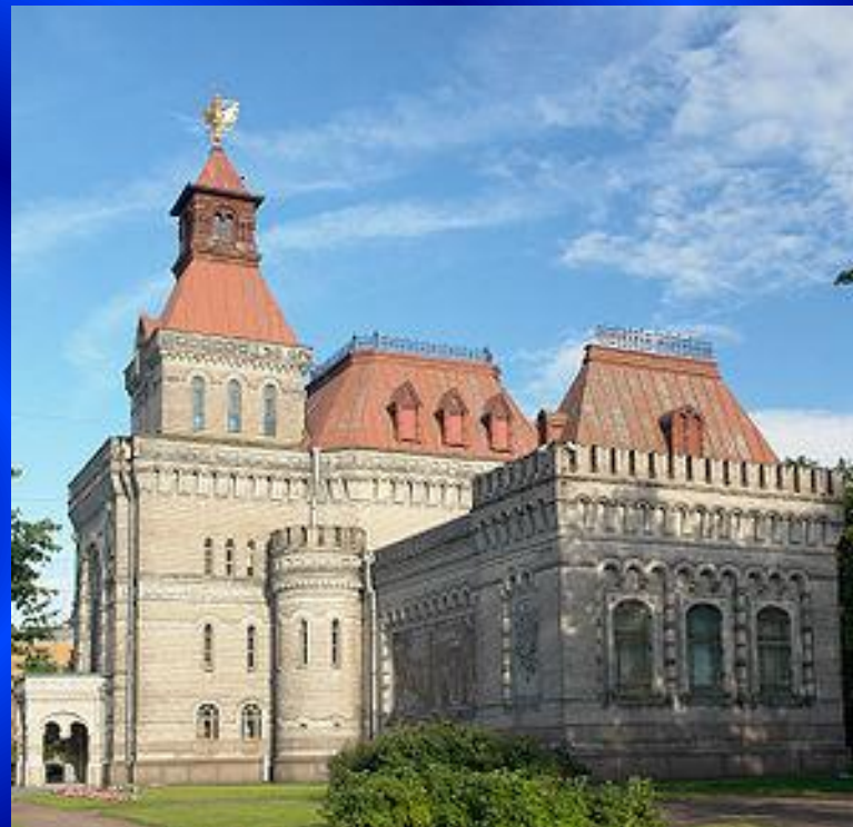
Мемориальный музей Суворова

Суворов был первым человеком, в честь которого в России был основан мемориальный музей, в Санкт-Петербурге в 1900 году, к столетней годовщине со дня смерти полководца. Торжественно открыт четырьмя годами позже, 13 (26) ноября 1904 года к 175-й годовщине со дня рождения Суворова, при участии императора Николая II.