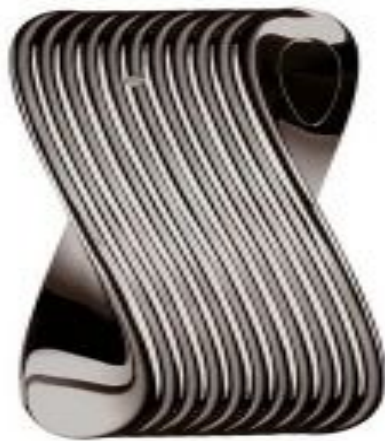
Рон Арад. Флакон для духов в виде ленты Мебиуса