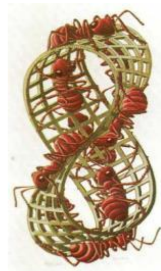
Мауриц Корнелис Эшер. Гравюра «Лента Мебиуса II (Красные муравьи)»