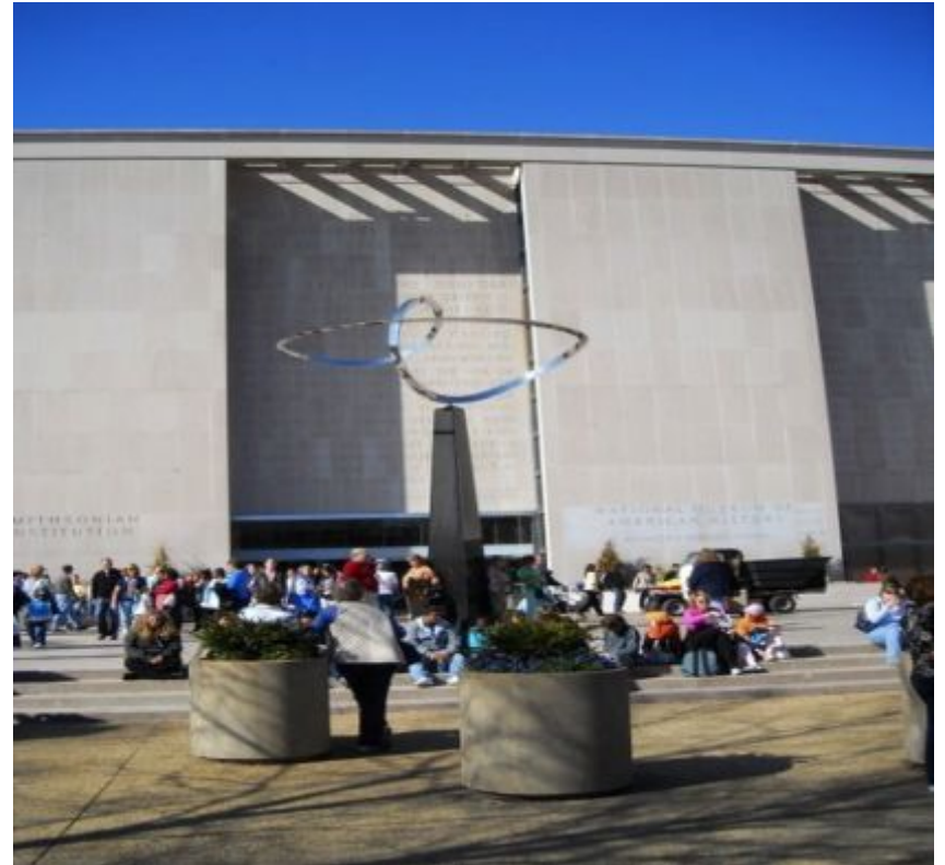
Вашингтон. Национальный Музей Американской Истории. Памятник ленте Мебиуса