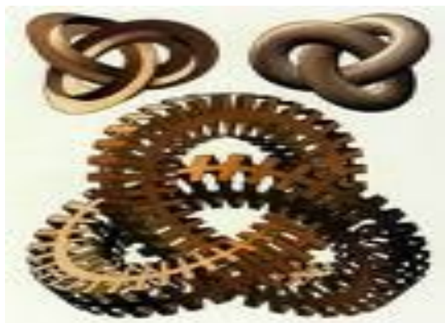
Мауриц Корнелис Эшер. Гравюра «Узлы»