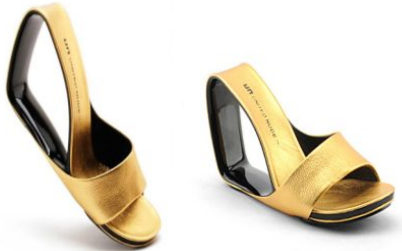
Рэм Колхаас. Остроумный силуэт туфель Мебиус