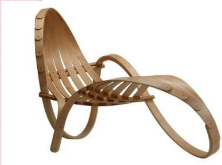
Шезлонг, представляющий собой ленту Мебиуса, склеенную из гнутого Британского дуба