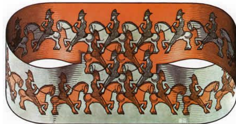
Мауриц Корнелис Эшер. Гравюра «Всадники»