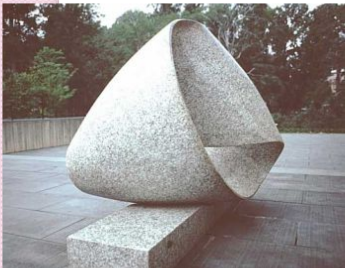
Макс Билль. Скульптура «Непрерывность» в национальном музее современного искусства в Париже