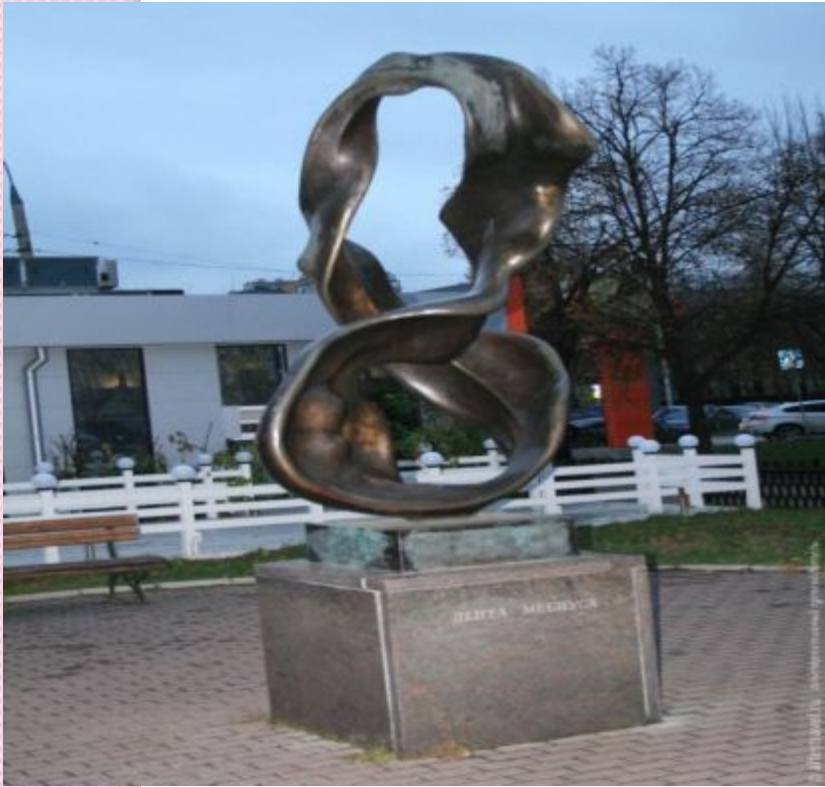
Москва. Комсомольский проспект. Памятник ленте Мебиуса