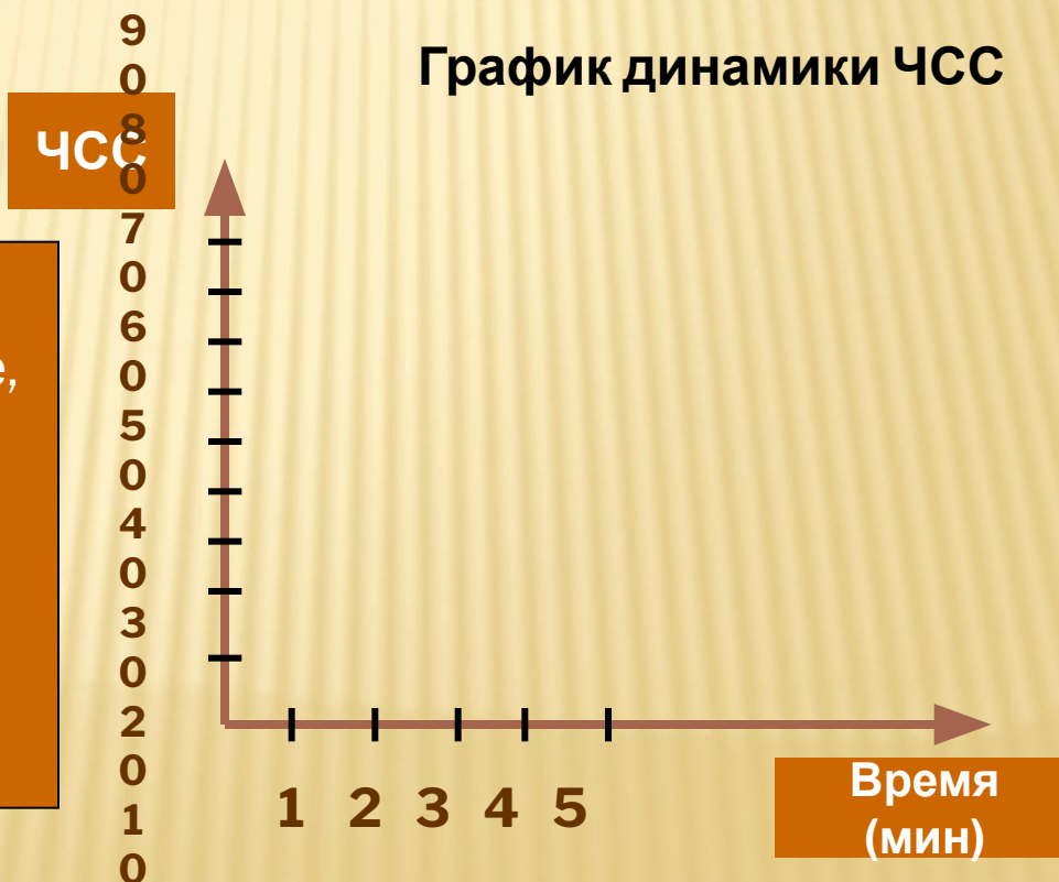
График динамики ЧСС

Если ЧСС увеличилась меньше, чем на 1/3, - результаты хорошие, если больше – то плохие