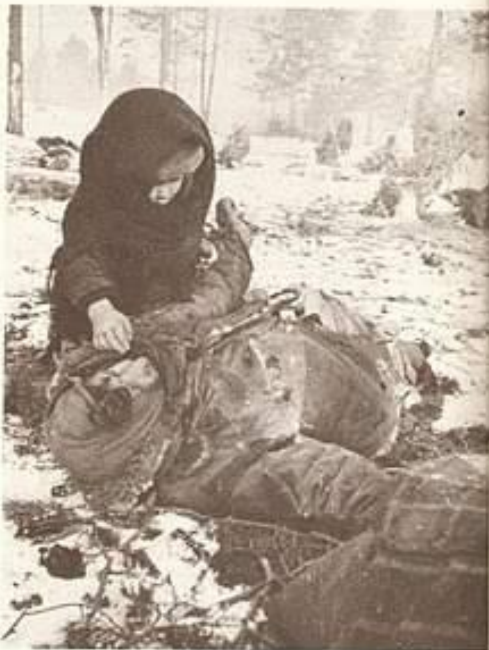
Ein Kind an der Leiche seiner Mutter, umgekommen in einem KZ für Zivilisten, nahe der Ortschaft Czestoch.