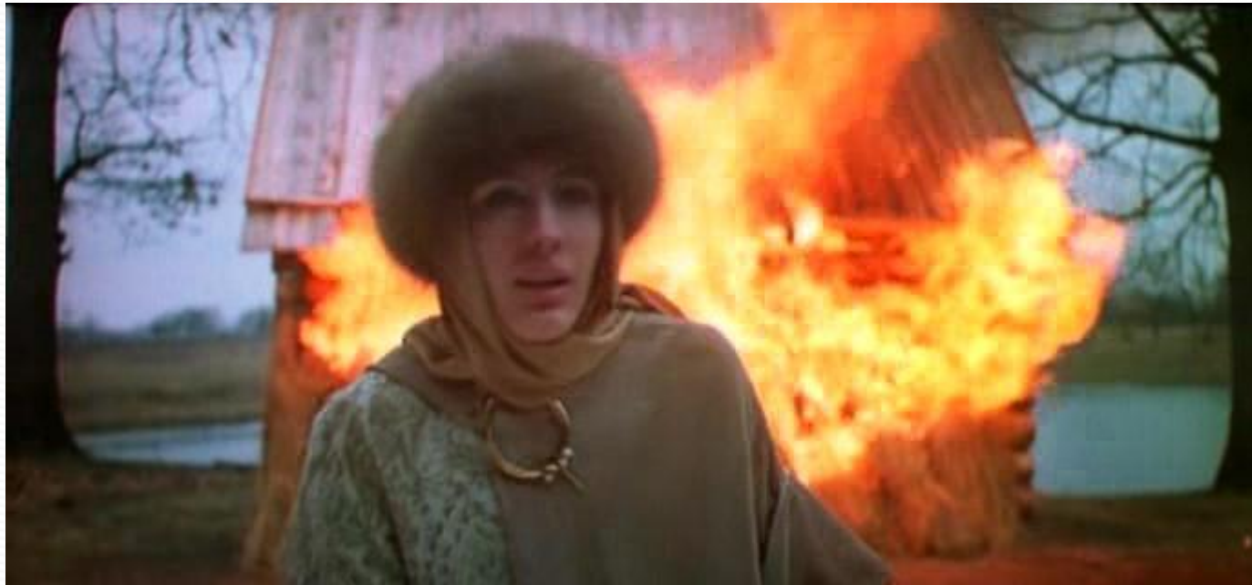
Кадр из кинофильма «Легенда о княгине Ольге», режиссёр Ю.Ильенко

Затем княгиня Ольга отправила своих послов в древлянскую землю с требованием прислать за ней лучших мужей, чтобы прийти к ним с великой честью. Новым послам была затоплена баня, куда их заперли, а потом сожгли.