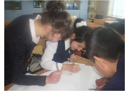
Во время групповой работы учащихся