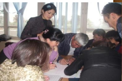
Инициативная группа Обсуждение в группе