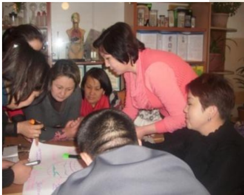
Обсуждение в группе