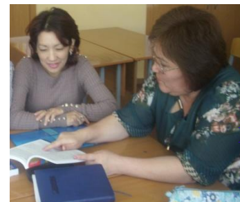
Менти Анализ посещенного урока