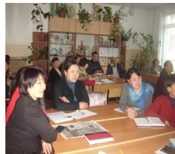
Педагогический коллектив на методическом совещании