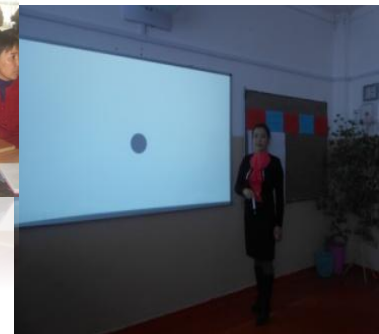
Психолог проводит тренинг с учителями