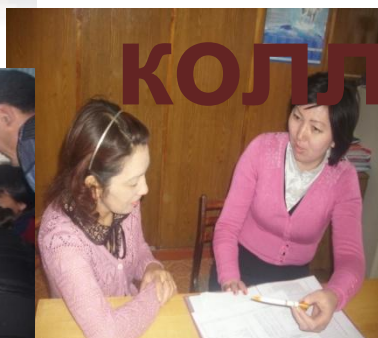
Коуч Планирование коучинга