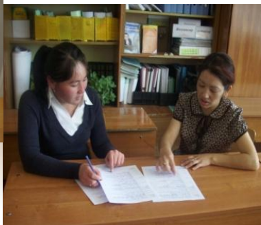
Ментор Корректировка плана