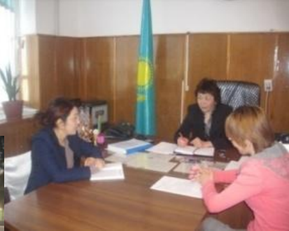
Встреча с директором школы