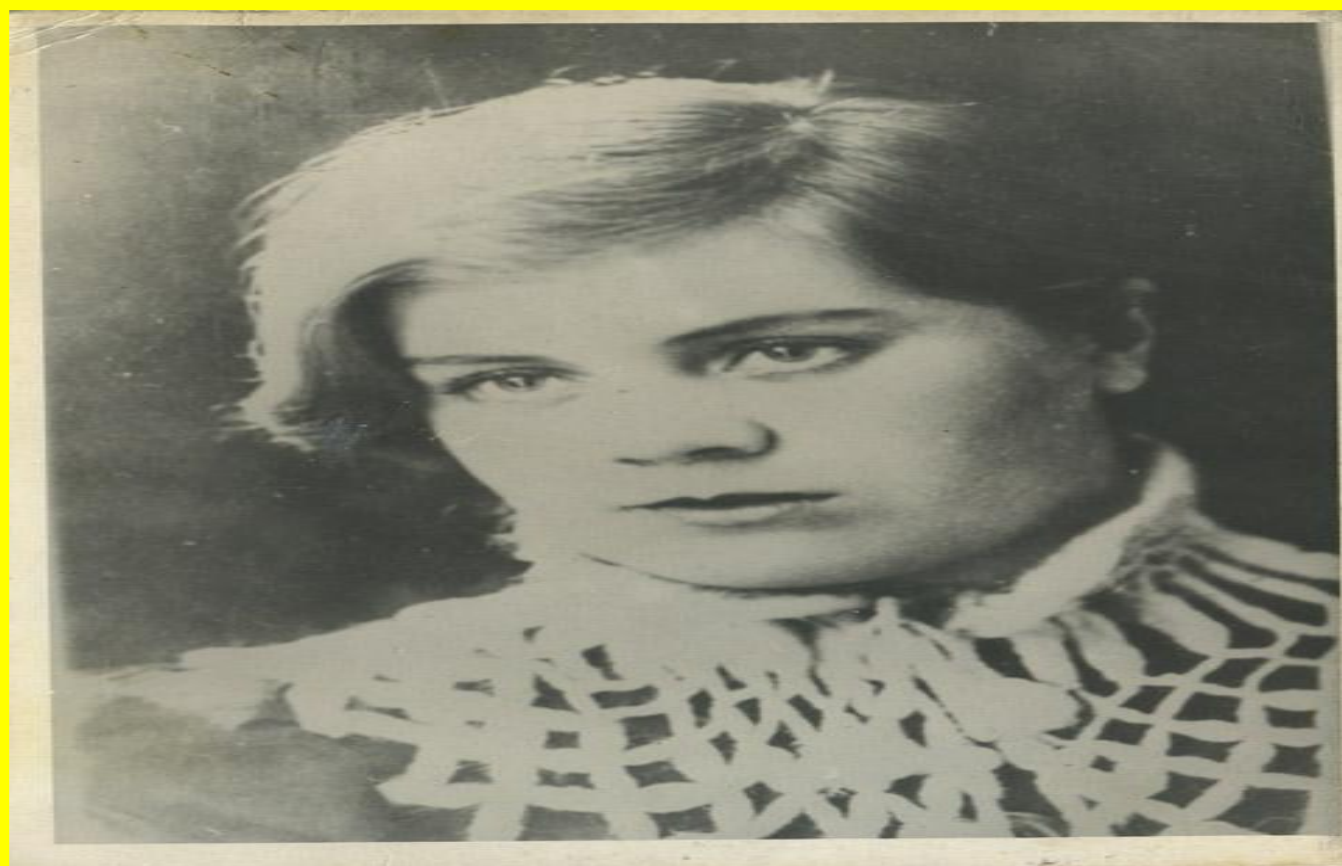
ФОТО 1941 ГОДА