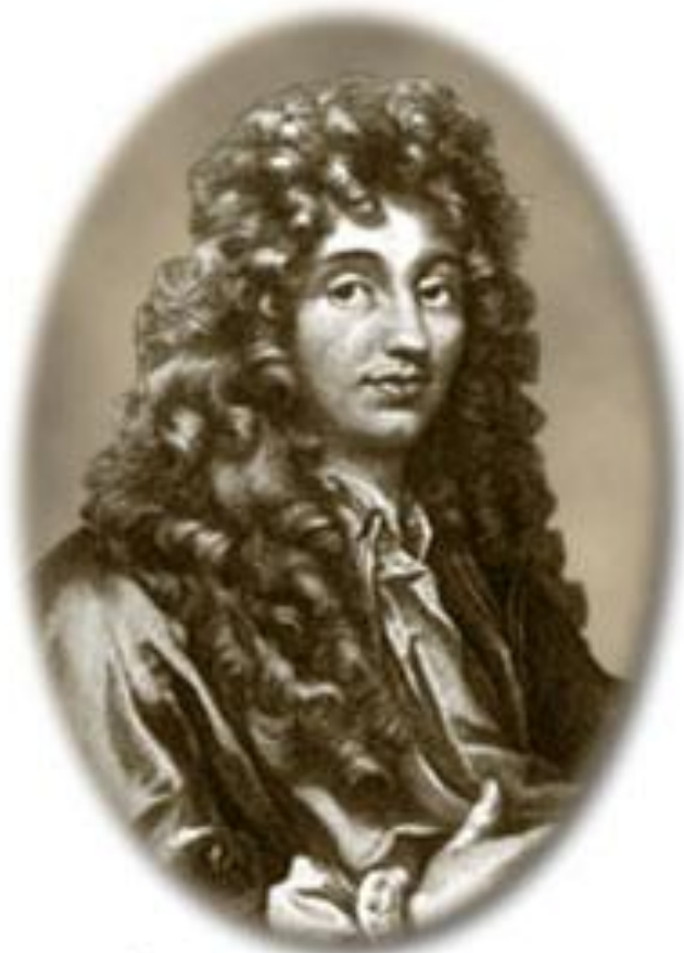
Christiaan Huygens (1629-1695)

Х. Гюйгенс в 1675 году впервые применил маятник для регулирования точности хода