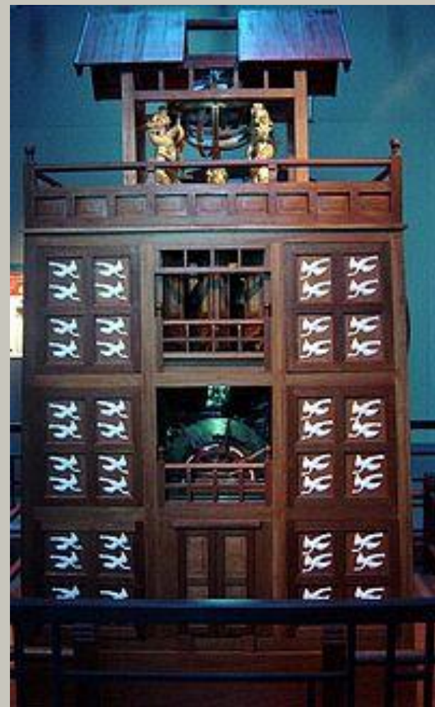
XI век , часы работы китайского учёного Су Суна