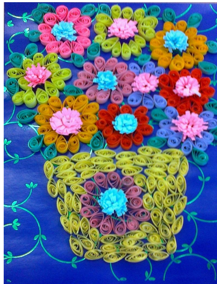
Некрасова Яна, ученица 4 класса