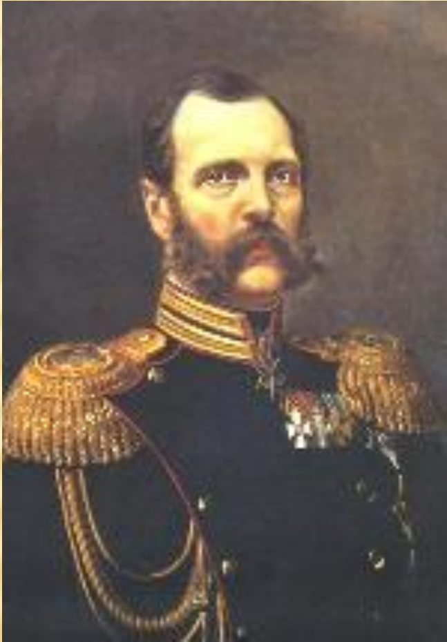
Император Александр II (1855 – 1881 )