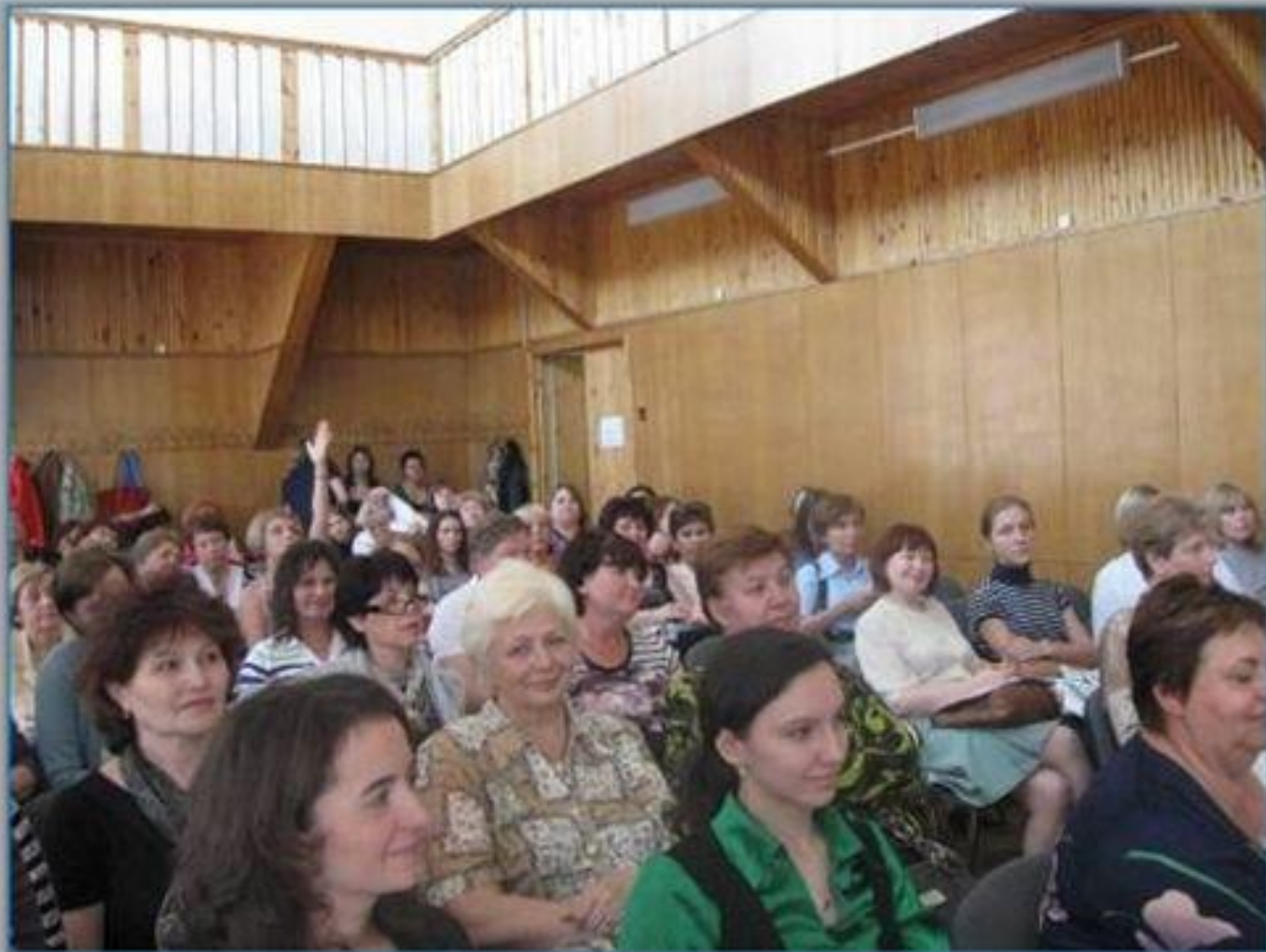
Семинар по подготовке к ГИА и ЕГЭ по французскому языку (июнь 2013)