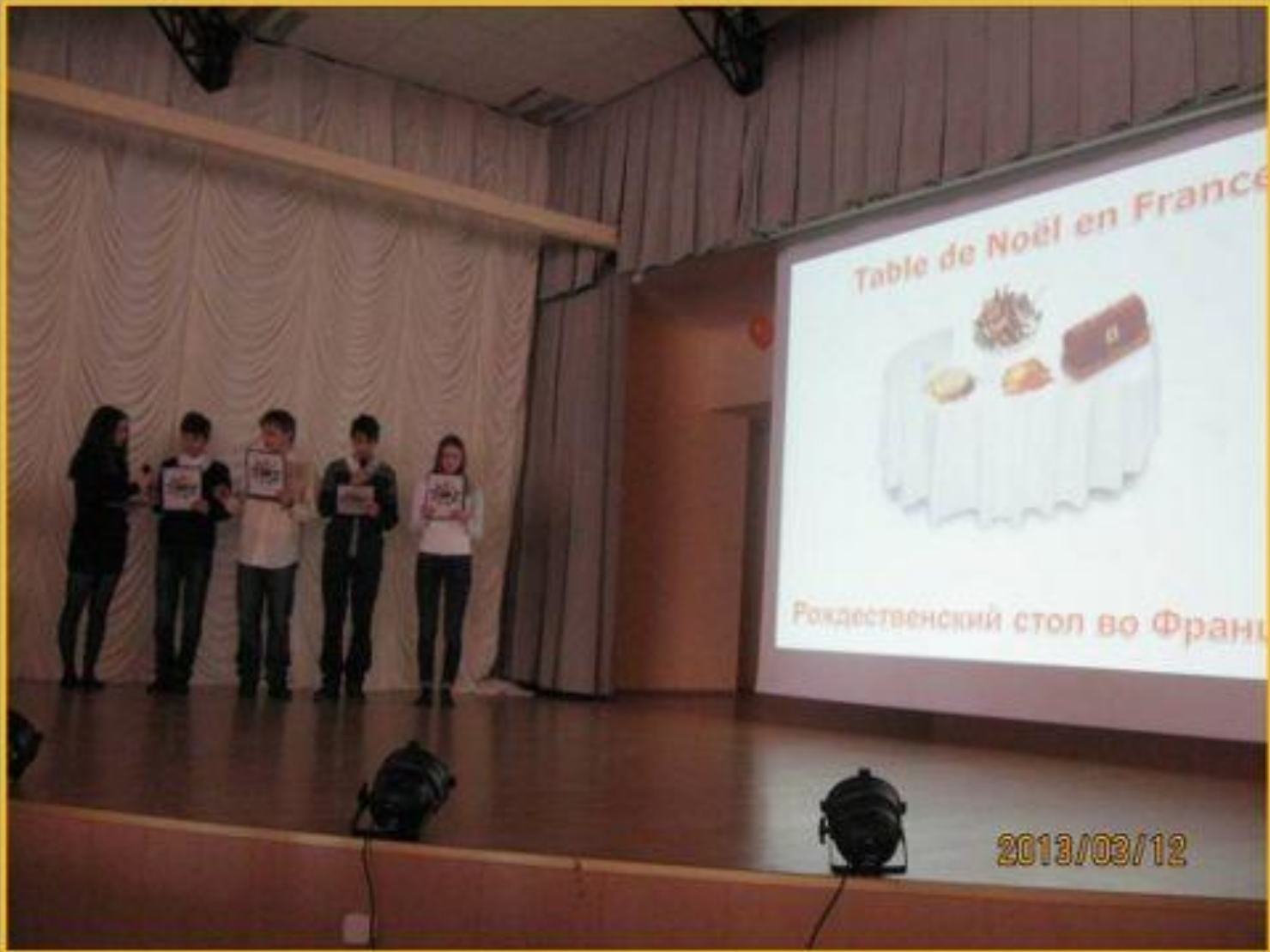
Table de Noël en France