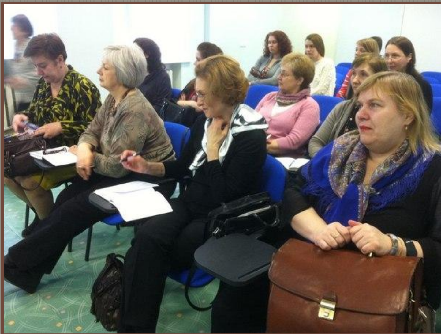
Традиционный мартовский семинар для учителей французского языка Санкт-Петербурга