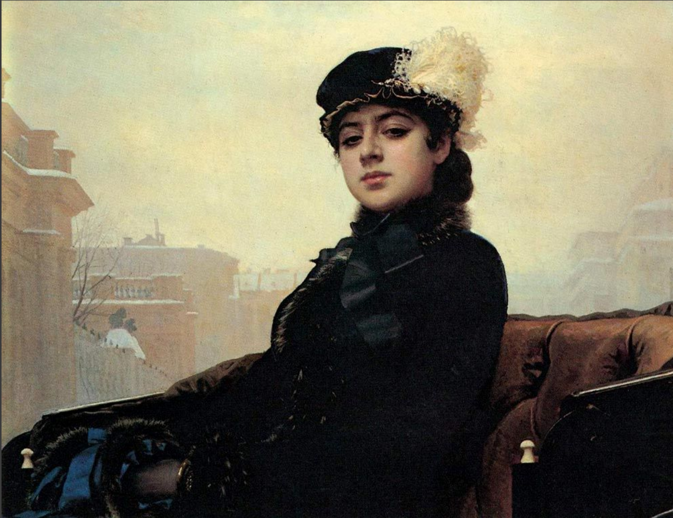
И.Н. Крамской «Портрет неизвестной»