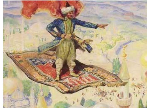
Ковер – самолет