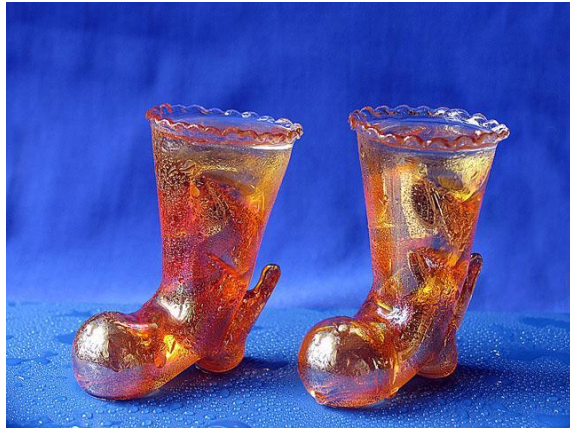
Сапоги – скороходы