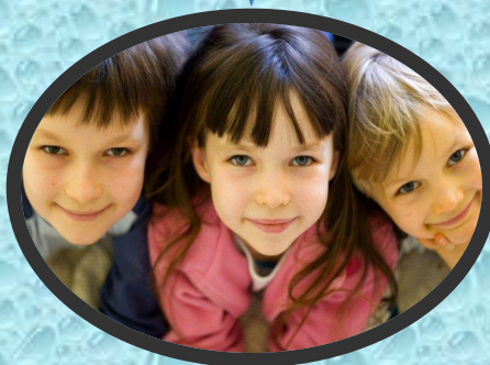
Дети 5 – 7 лет