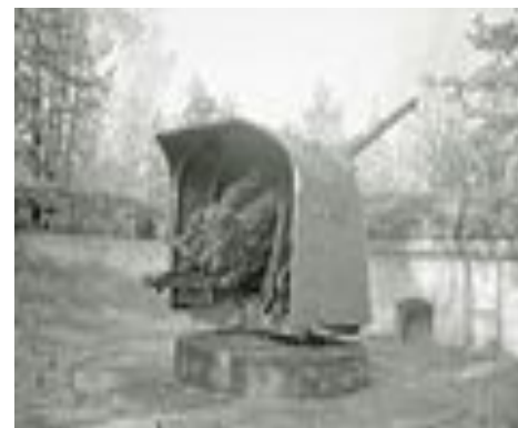
130-мм корабельная пушка образца 1935 года (Б-13)