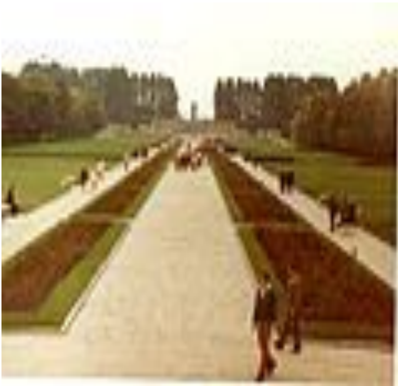
Пискаре́вское мемориальное кладбище