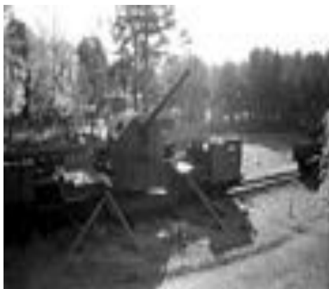
180 мм орудие на ж.д. транспортёре