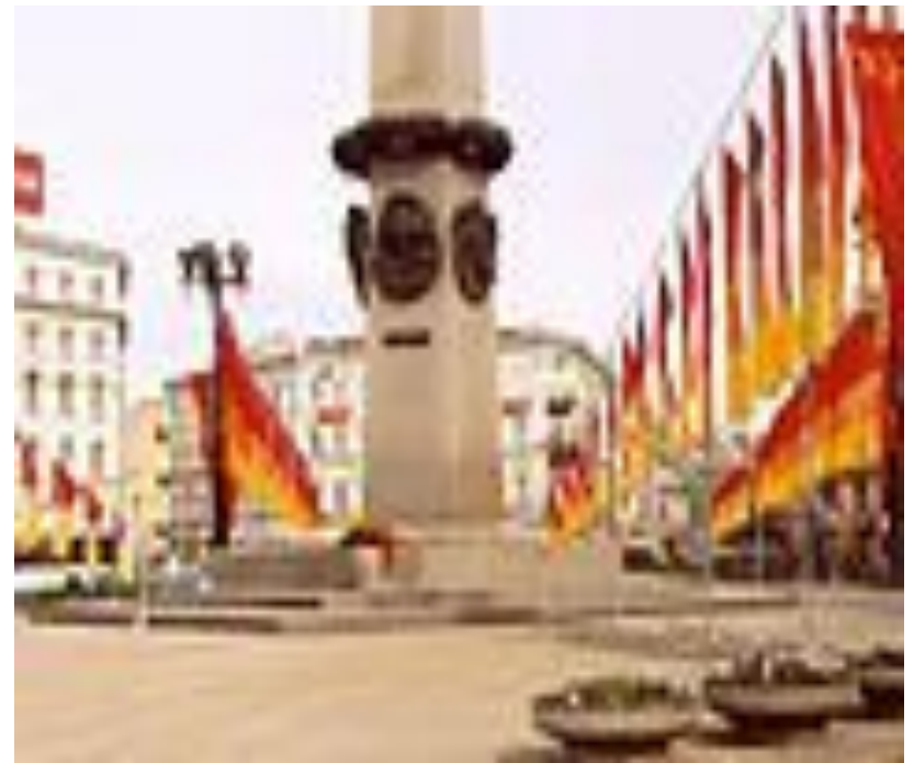
Обелиск «Городу-герою Ленинграду»