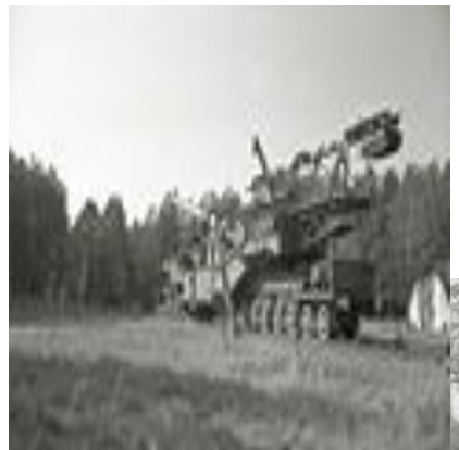
305 мм орудие на ж.д. транспортёре (вид с казённой части)