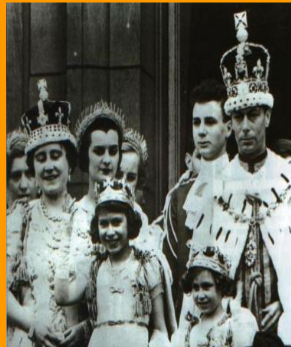
ЕЛИЗАВЕТА ВТОРАЯ С РОДИТЕЛЯМИ И СЕСТРОЙ

Королева Елизавета II родилась 21 апреля 1926 года в Лондоне.