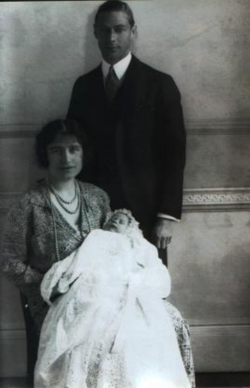
ЕЛИЗАВЕТА ВТОРАЯ С РОДИТЕЛЯМИ