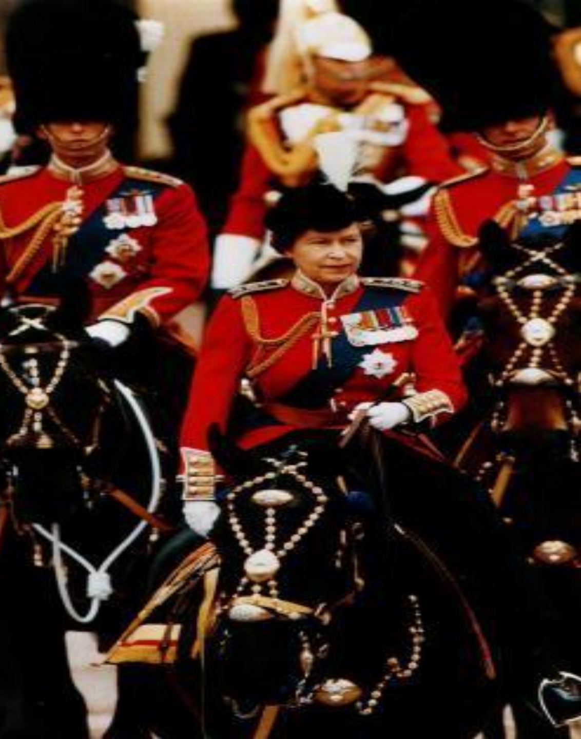
ЕЛИЗАВЕТА ВТОРАЯ НА ПАРАДЕ