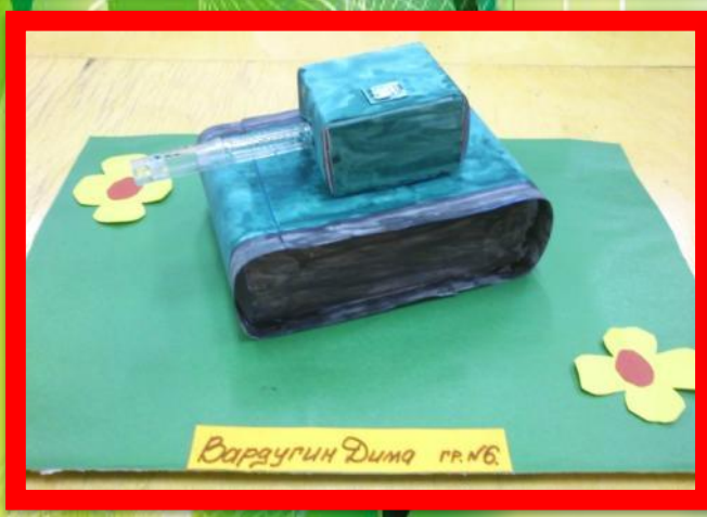
Варагуин Дима 11.06