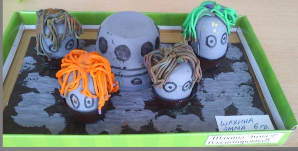
ШАХИНА ЭММА 6 гр. Шахина Эмма 6 гр. Шахина Эмма 6 гр.