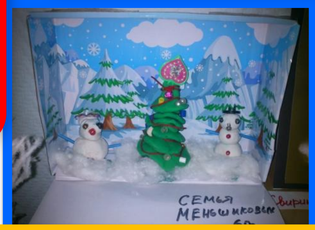
СЕМЬЯ МЕНШКОВСКИХ 6 гр.