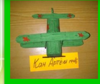
Кан Артем 10.06