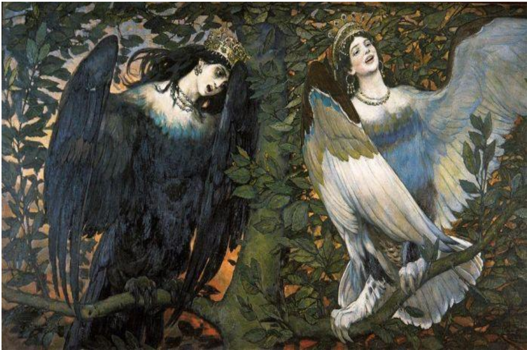
«Сирин и Алконост. Песнь радости и печали» В. М. Васнецов