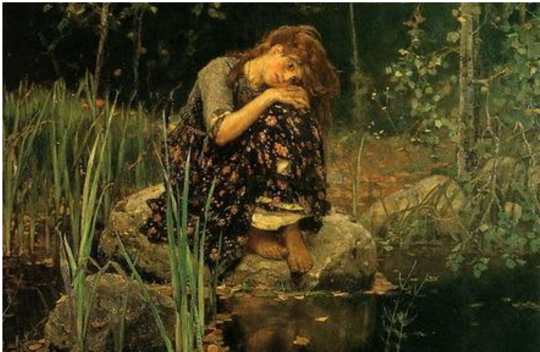
«Аленушка» В. М. Васнецов