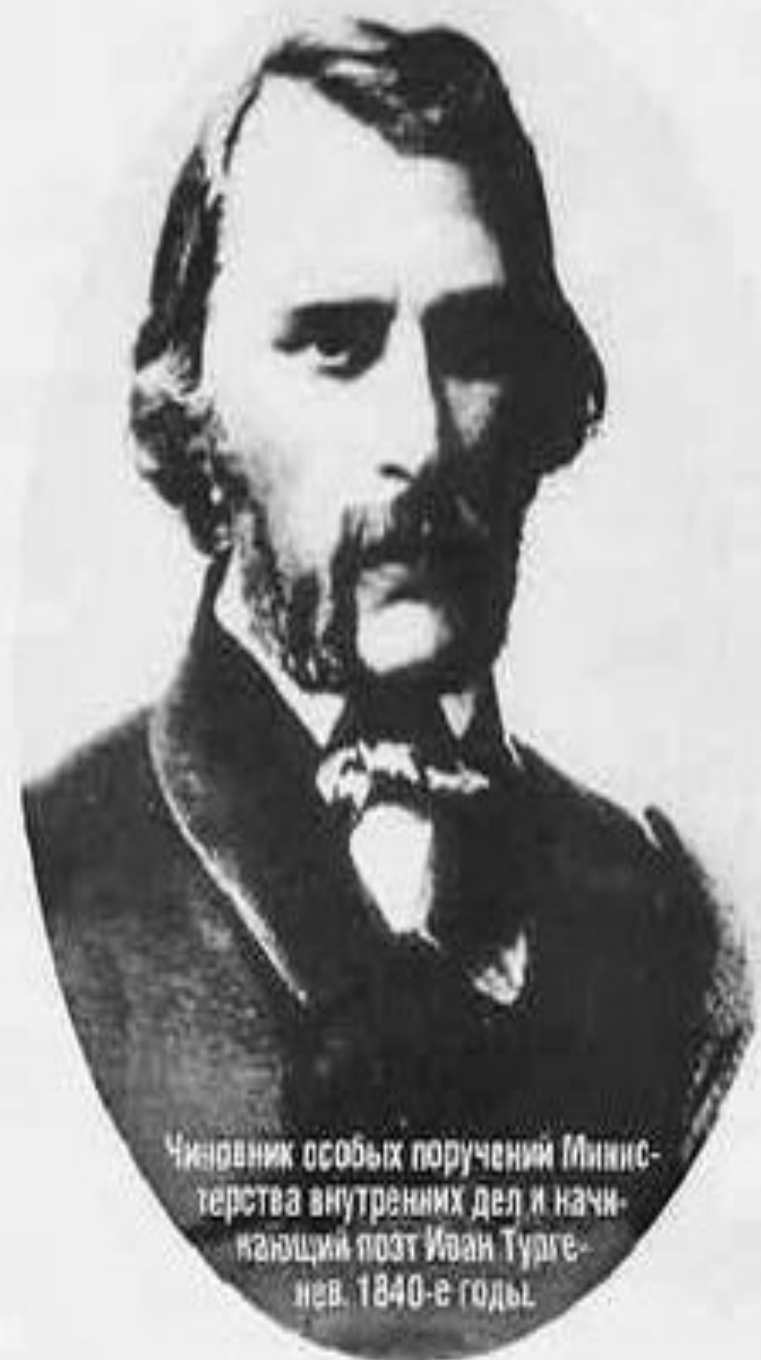
Чинovníк особых поручений Министерства внутренних дел и начинающий поэт Иван Тургенев. 1840-е годы.