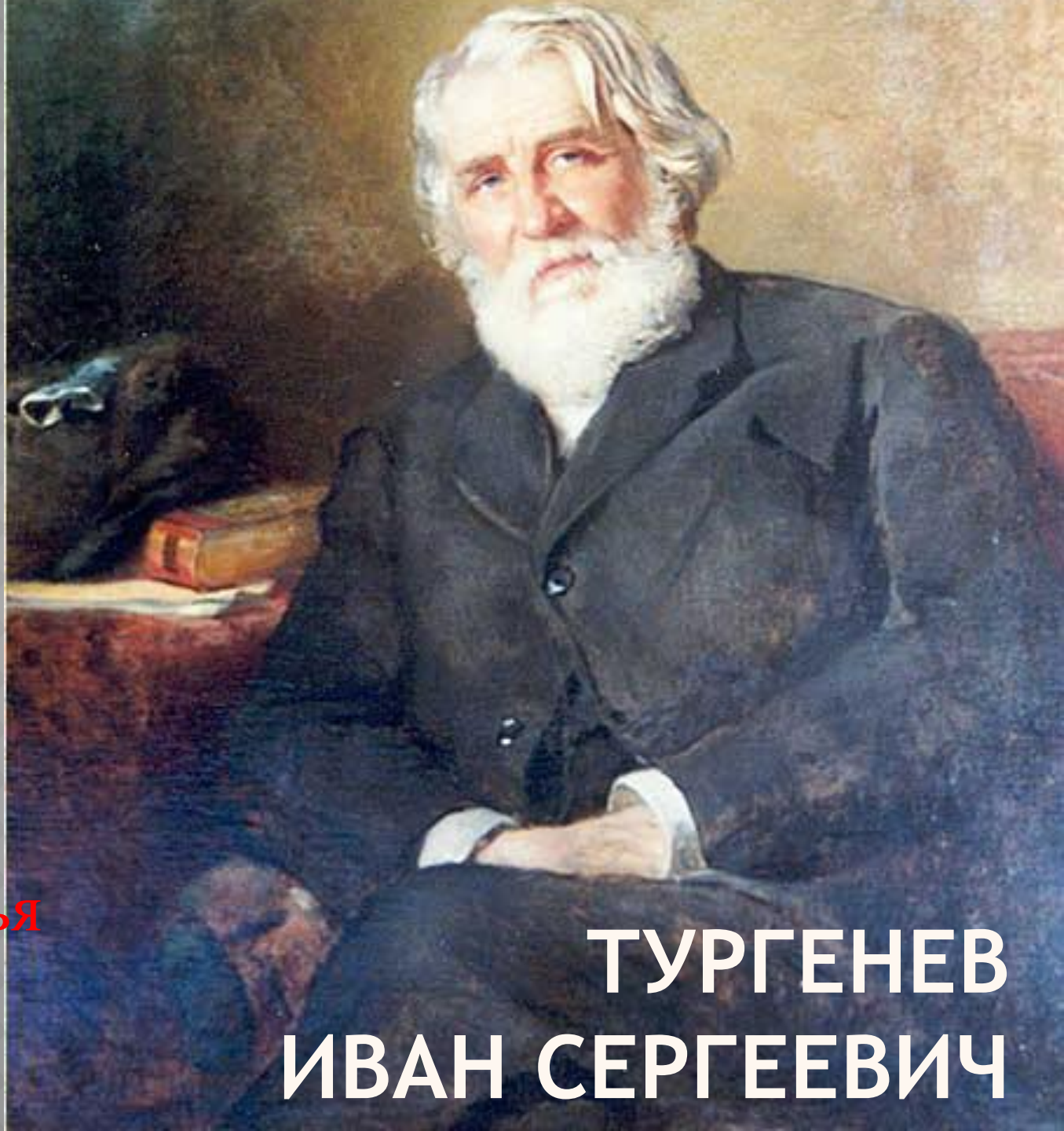
ТУРГЕНЕВ ИВАН СЕРГЕЕВИЧ