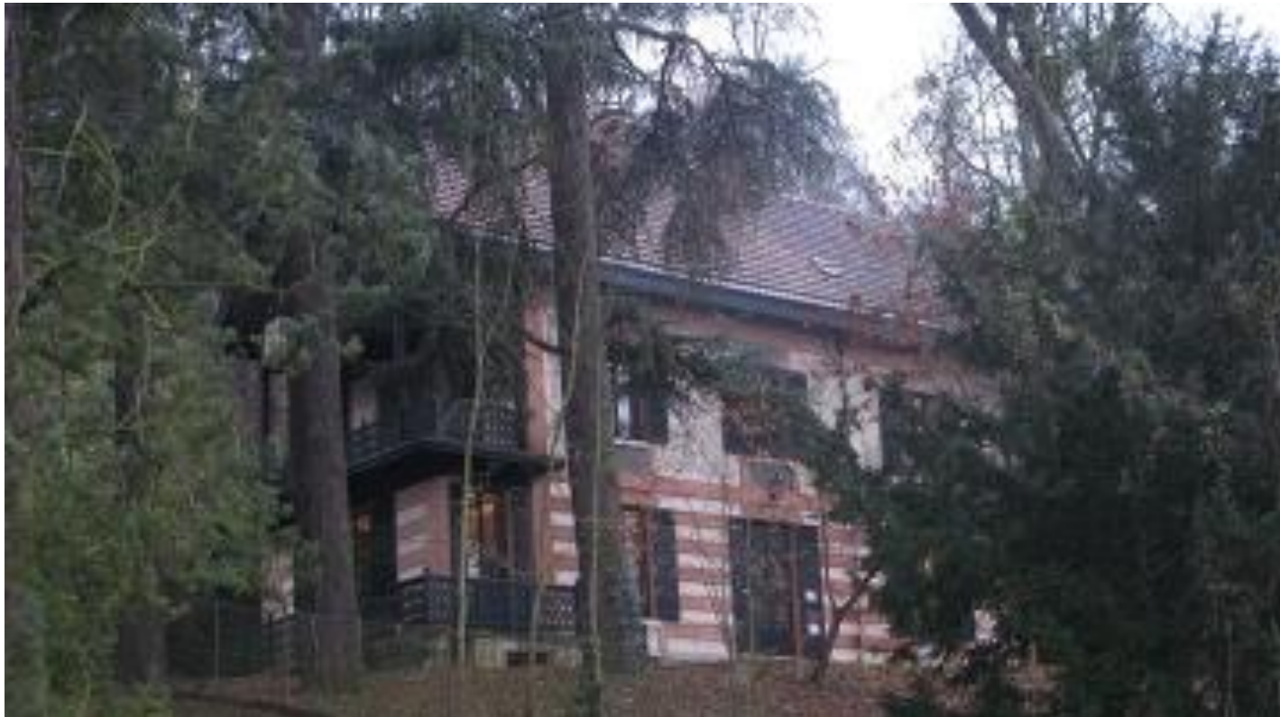
Дом Тургенева в усадьбе «Ясени» в Буживале

К концу жизни слава Тургенева достигла своего апогея как в России, где он опять становится всеобщим любимцем, так и в Европе, где критика, в лице самых выдающихся своих представителей - Тэна, Ренана, Брандеса и др. - причислила его к первым писателям века.