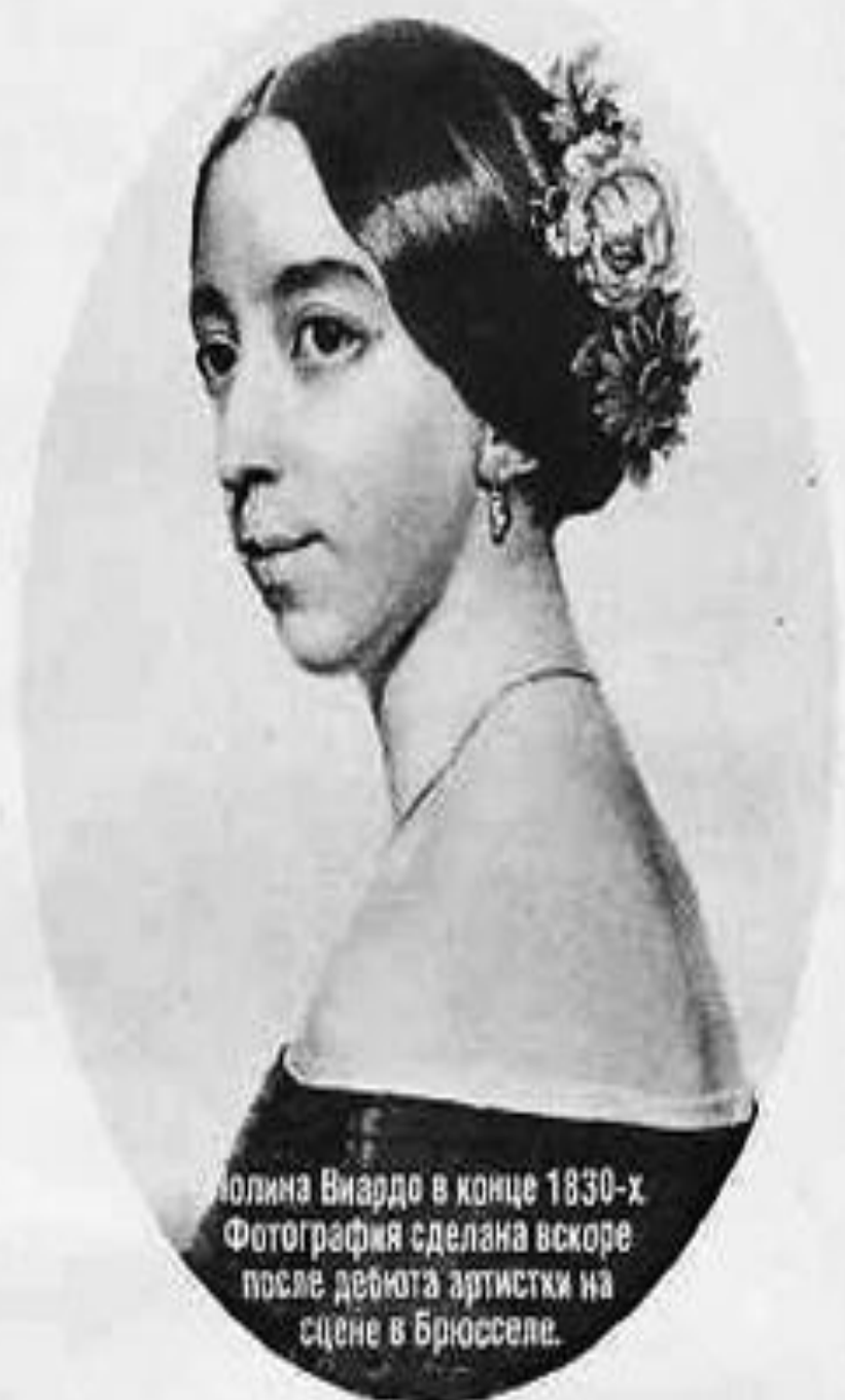
Солина Виардо в конце 1830-х. Фотография сделана вскоре после дебюта артистки на сцене в Брюсселе.