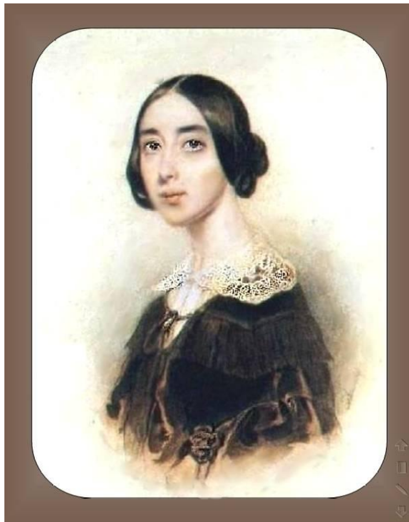
Полина Виардо (Виардо-Гарсия)