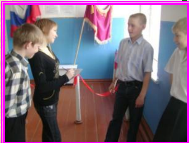
Социологический опрос с учащимися школы