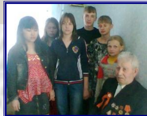
Интервью с участником Великов Отечественной войны