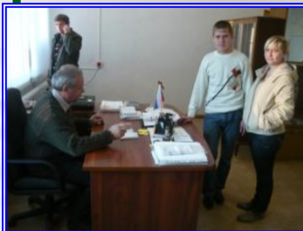
Встреча с главой Волжского сельсовета