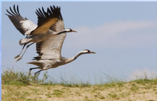
Эртенги эжеш дуруяапар