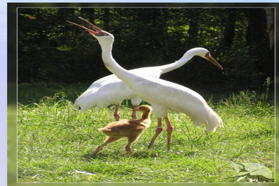
Оолдарлыг эжеш дуруяапар