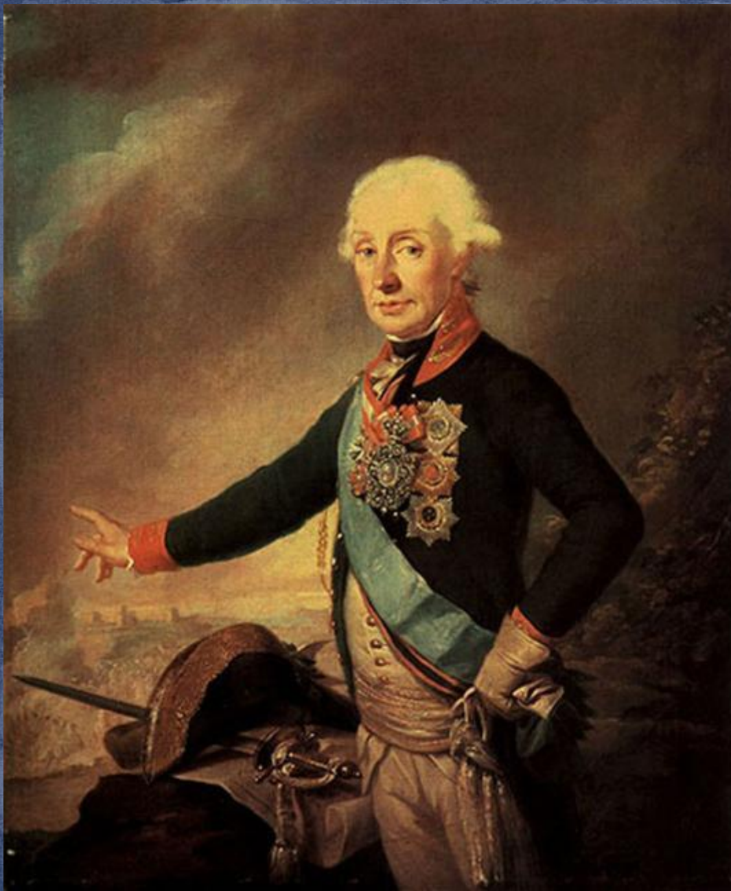
Генералиссимус Суворов А.В.