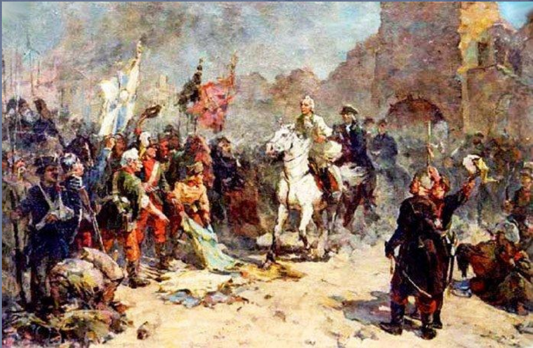
Въезд в ворота Измаила