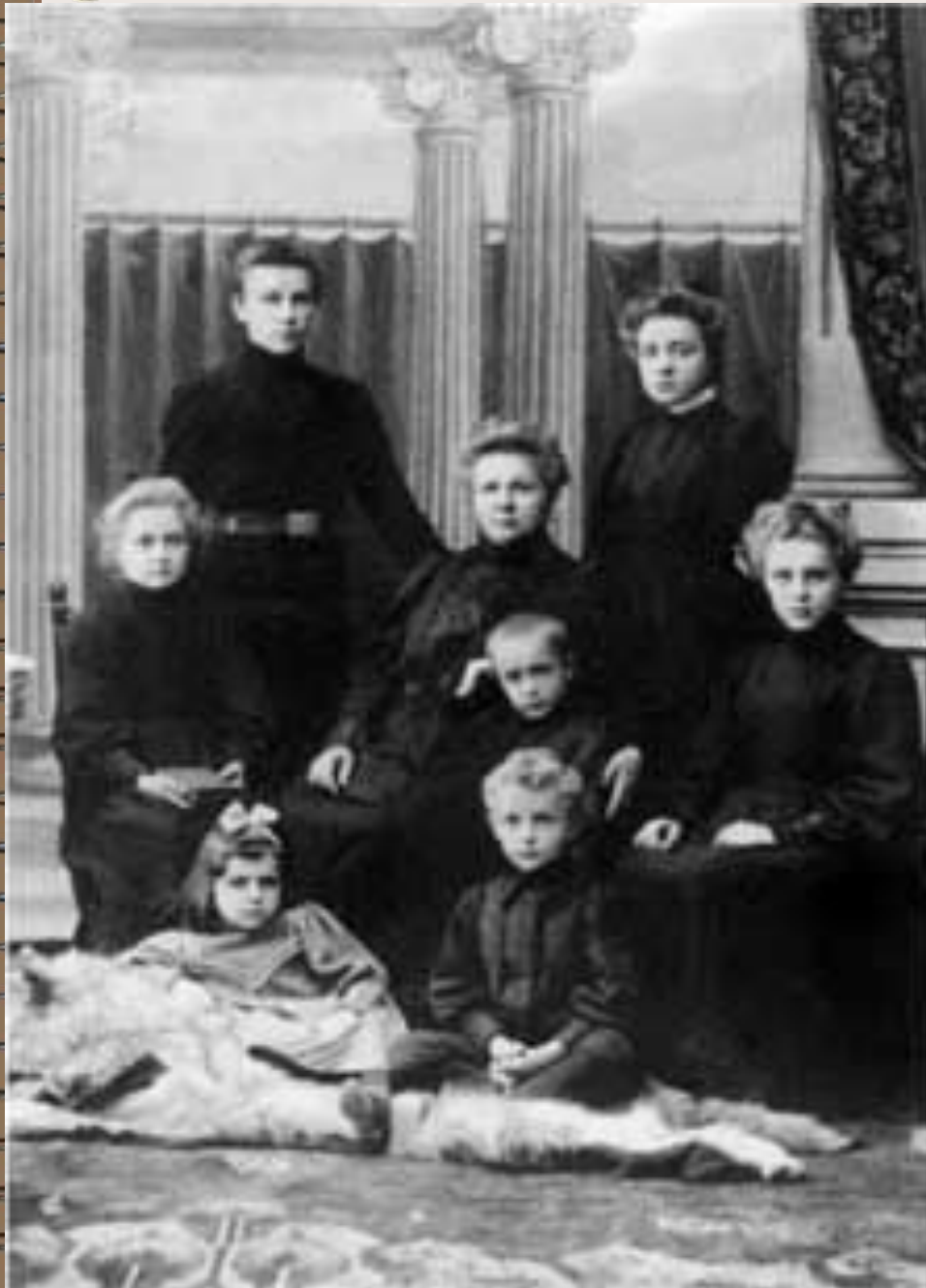
Семья Булгаковых после смерти отца