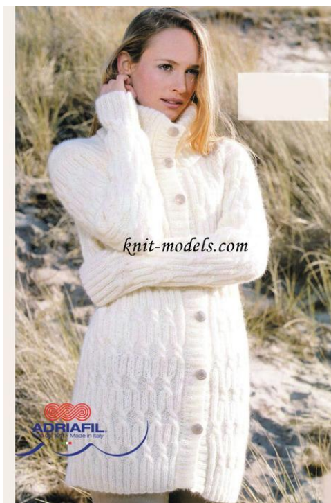
Кардиган на пуговицах.