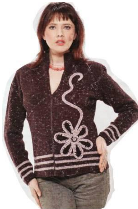
Свитер на молнии.