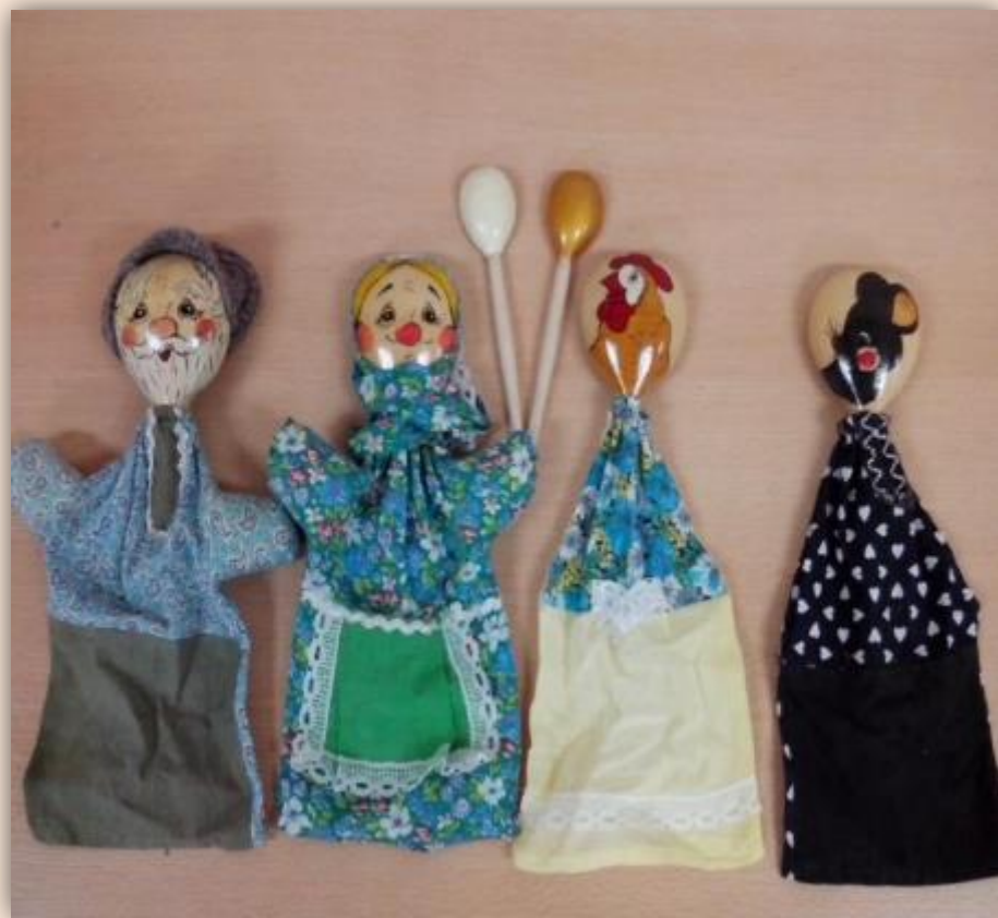
Сказка «Курочка Ряба»