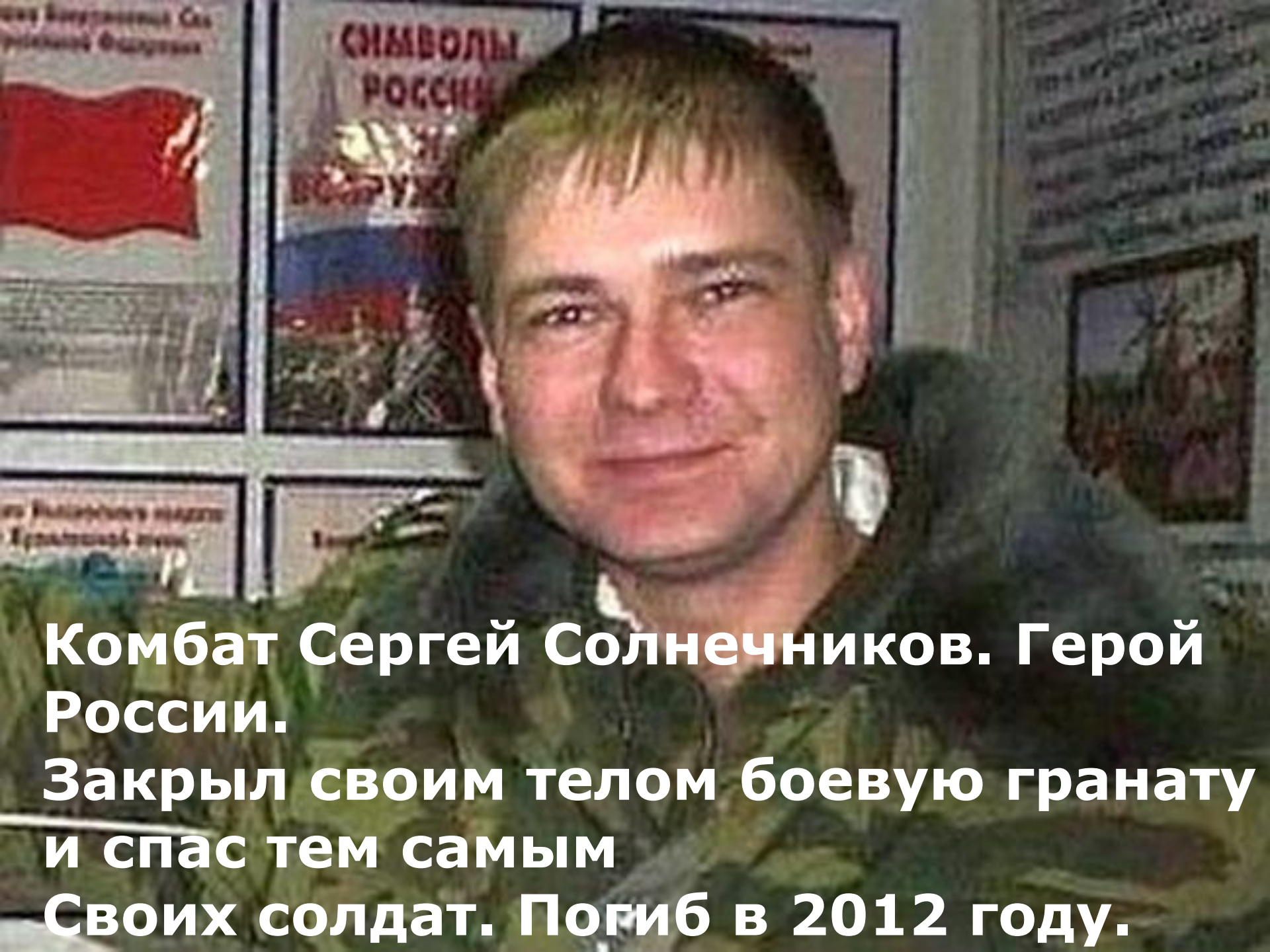
Комбат Сергей Солнечников. Герой России. Закрыл своим телом боевую гранату и спас тем самым Своих солдат. Погиб в 2012 году.