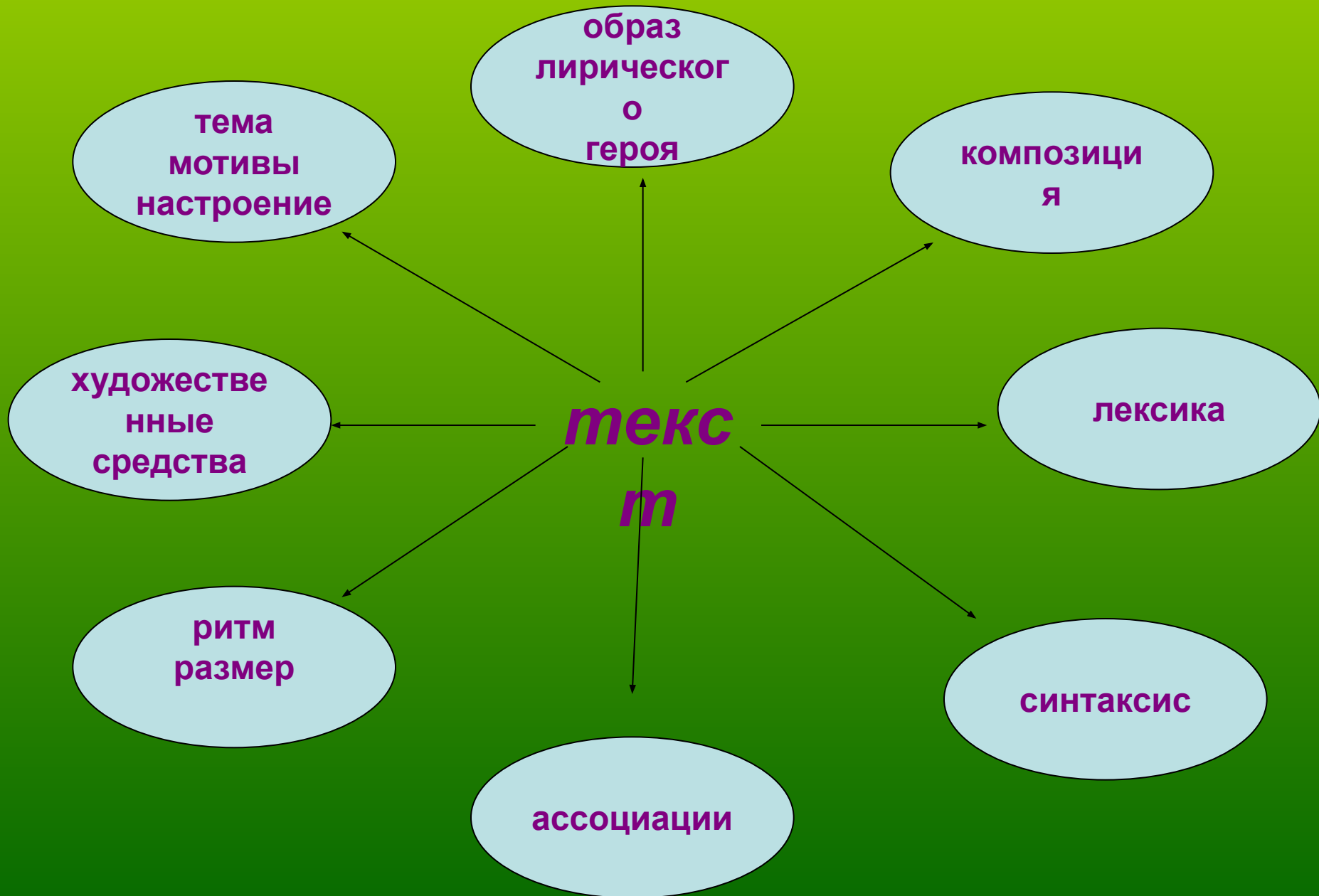
Схема анализа поэтического текста