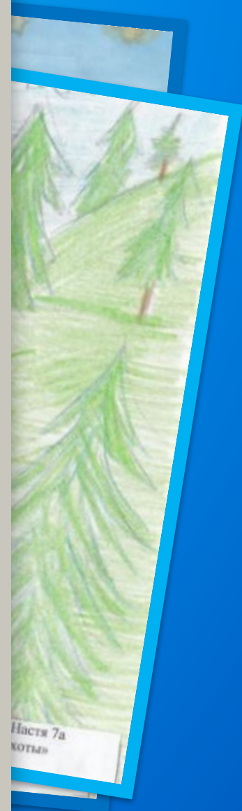
Настя 7а «Коты»