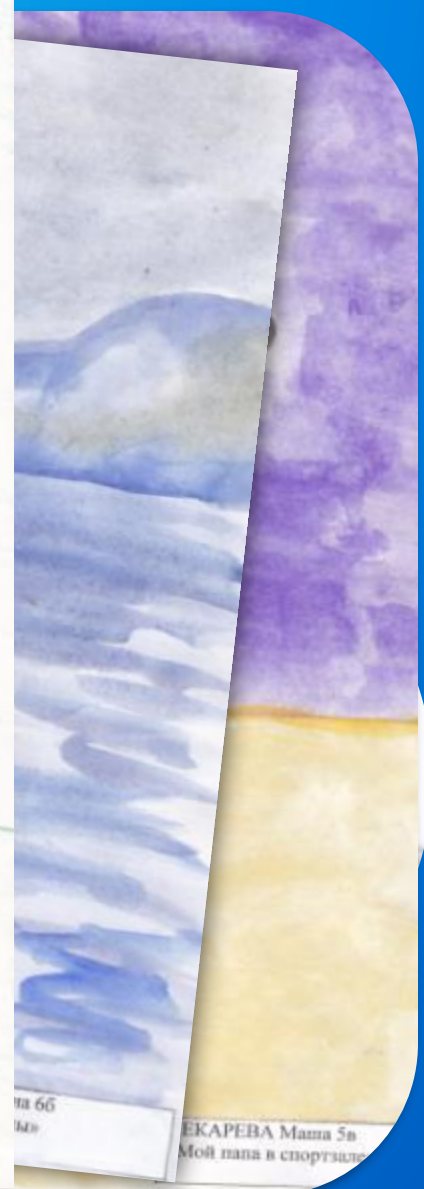
на 66 ыл»